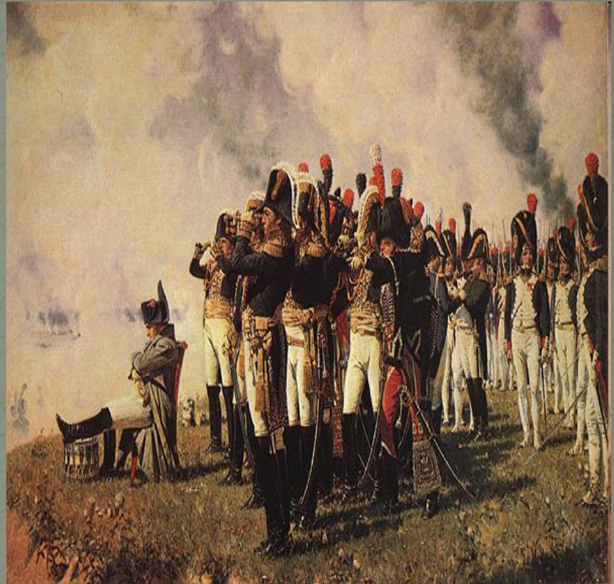
В.В. Верещагин Наполеон I на Бородинских высотах

Нижегородцы приняли самое непосредственное участие в этих событиях, стар и млад вливались в ряды ополчения, чтоб преградить путь жадному до побед и могущественному врагу.