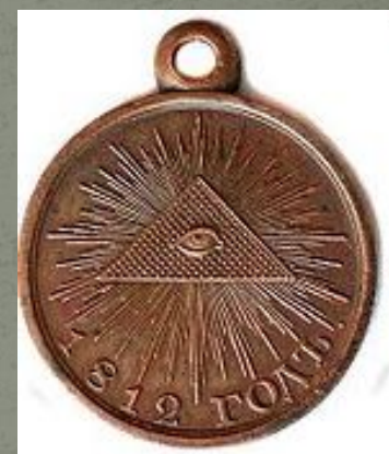
I I степени для купечества и дворянства