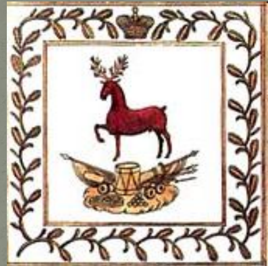
Знамя Нижегородского ополчения