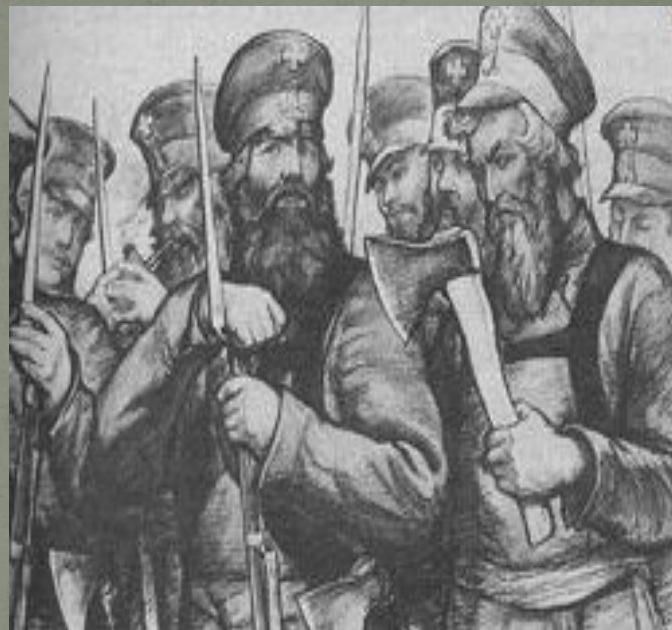
Ополченцы в 1812 г. Художник И. Архипов.

Обнародованный 17 июля манифест призывал народ к защите отечества. Нижегородцы, как и двести лет перед этим, встретили известие взрывом патриотического чувства и готовностью отдать все свои силы для изгнания врага из пределов родной земли.