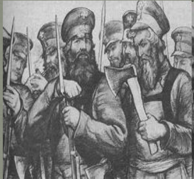
Ополченцы в 1812 г. Художник И. Архипов.

Обнародованный 17 июля манифест призывал народ к защите отечества. Нижегородцы, как и двести лет перед этим, встретили известие взрывом патриотического чувства и готовностью отдать все свои силы для изгнания врага из пределов родной земли.