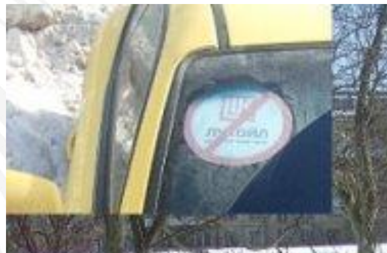
Фотография в альбоме Вконтакте