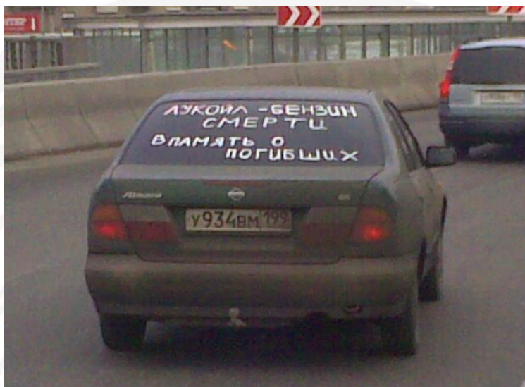
Съезд на третье кольцо с Кутузовского проспекта, 13 марта 2010, 16:50