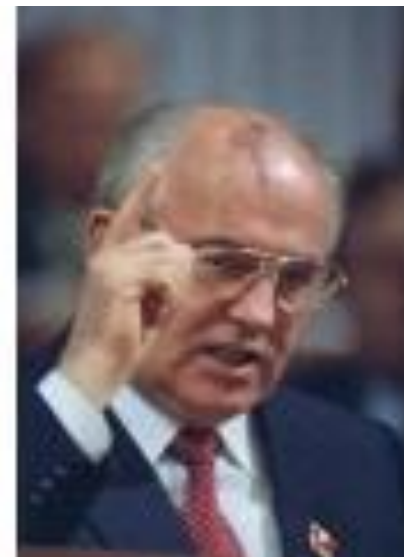
Л. И. Брежнев