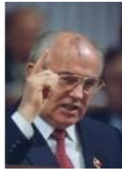
Л. И. Брежнев