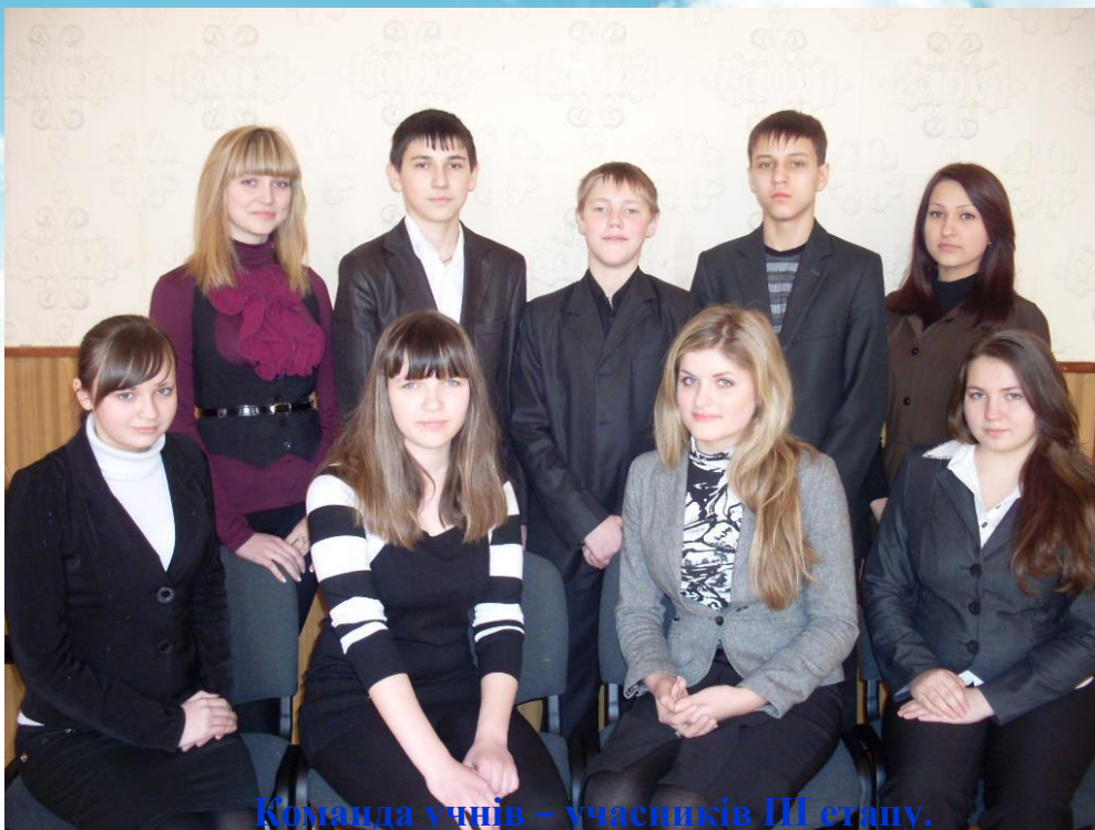
Команда учнів - учасників III етапу.

Команда школи посіла II місце в II етапі Всеукраїнських учнівських олімпіад з базових дисциплін.