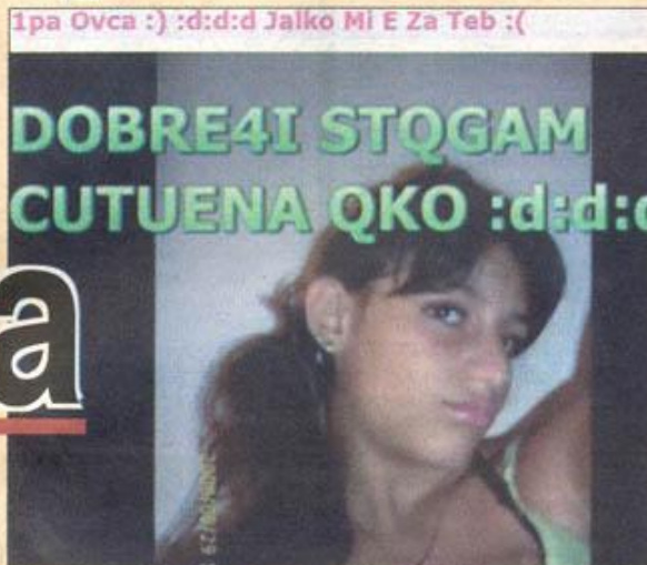
Понякога обидите са върху снимките на жертвата.

робно коя е героинята - ят вариант е текстовете например Михаела от еди- да се вмъкнат между