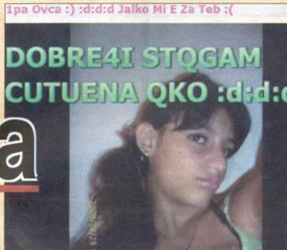
Понякога обидите са върху снимките на жертвата.

робно коя е героинята - ят вариант е текстовете например Михаела от еди- да се вмъкнат между