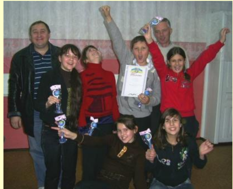
Що? Де? Коли?