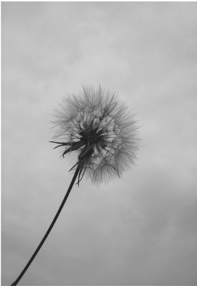
До начала выборов