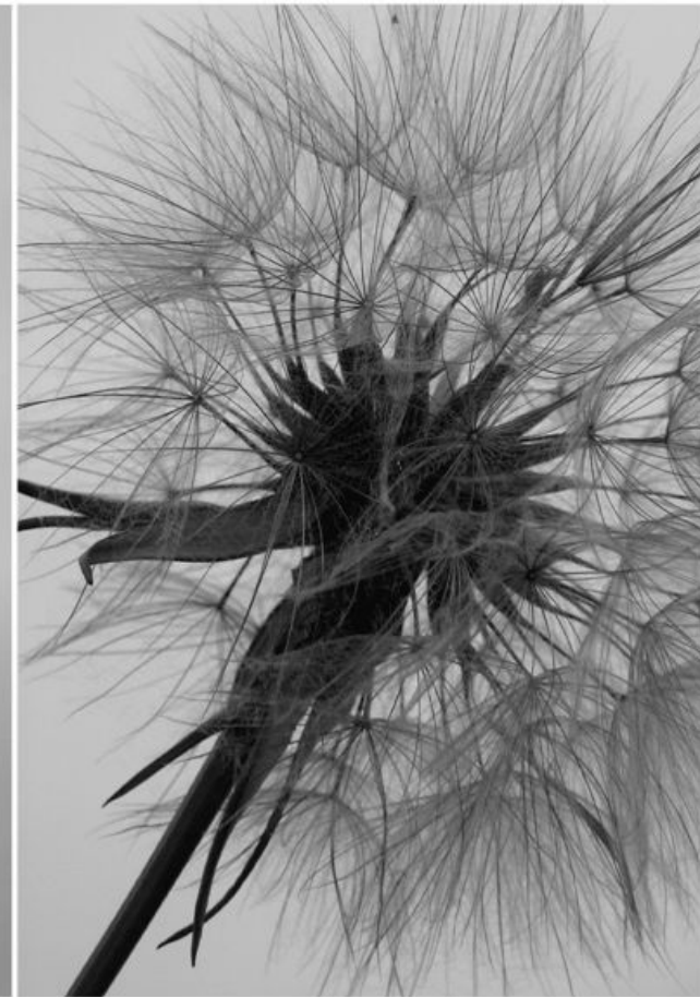
По окончании выборов