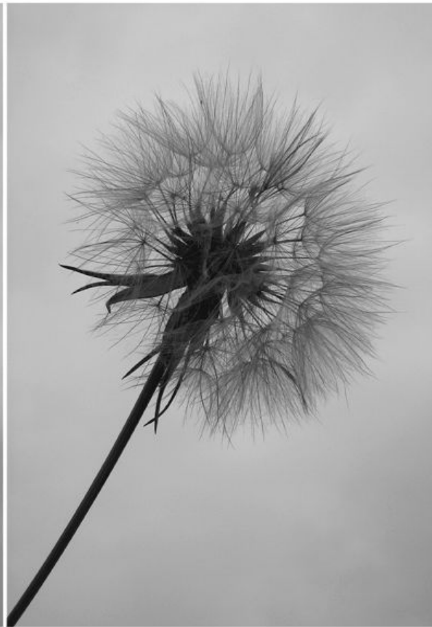
В ходе выборов