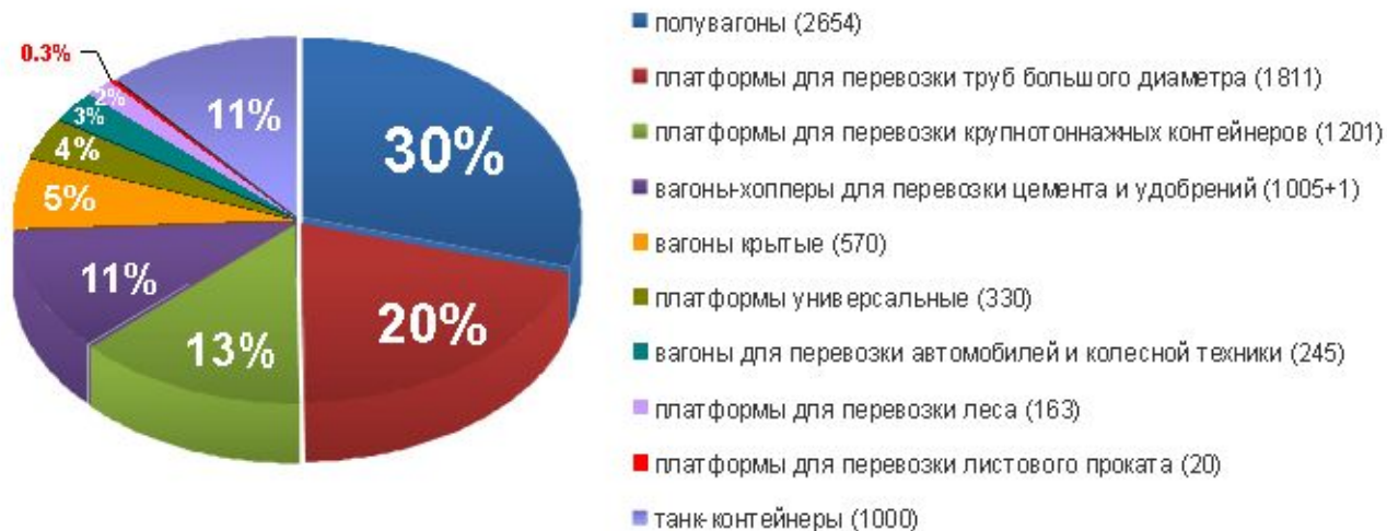
Структура парка ЗАО «Универсал ТрансГрупп» (на 12.2008)

ЗАО «Универсал ТрансГрупп» постоянно диверсифицирует и увеличивает парк подвижного состава. Общее количество вагонов составляет 8000 единиц, а также 1000 танк-контейнеров.