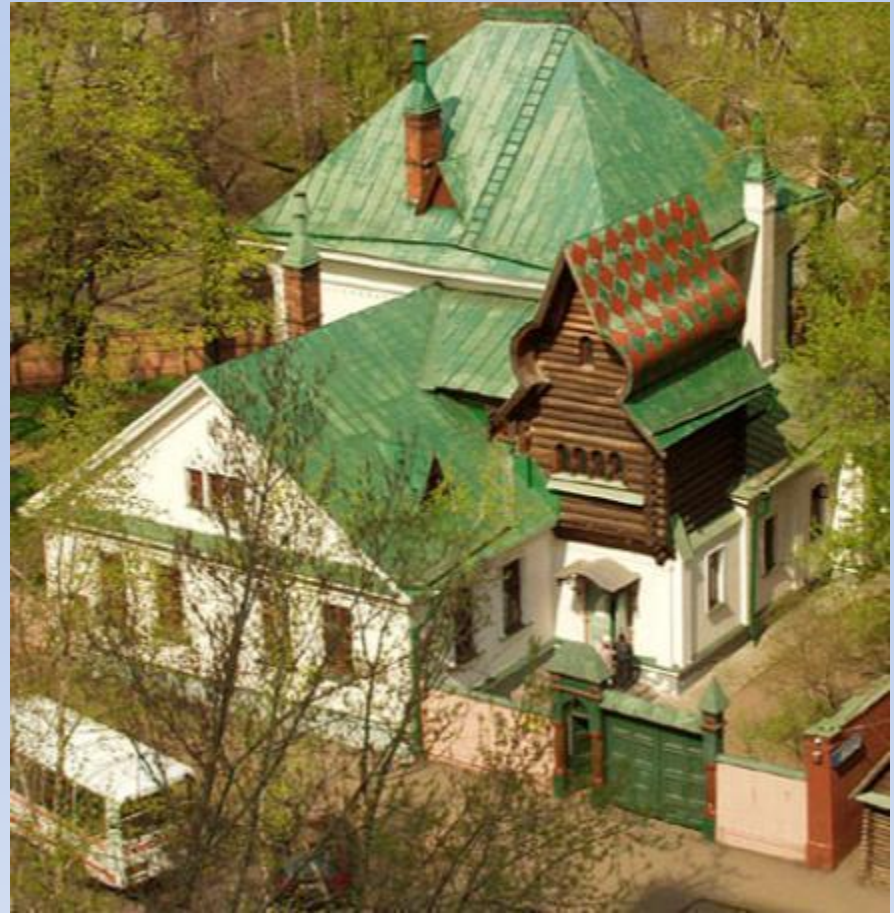
Дом-музей художника Васнецова

В Дмитровском районе более 200 объектов историко-культурного наследия., среди них усадьбы Ольгово, Горки, Даниловское, Храброво, дом-музей Васнецова.