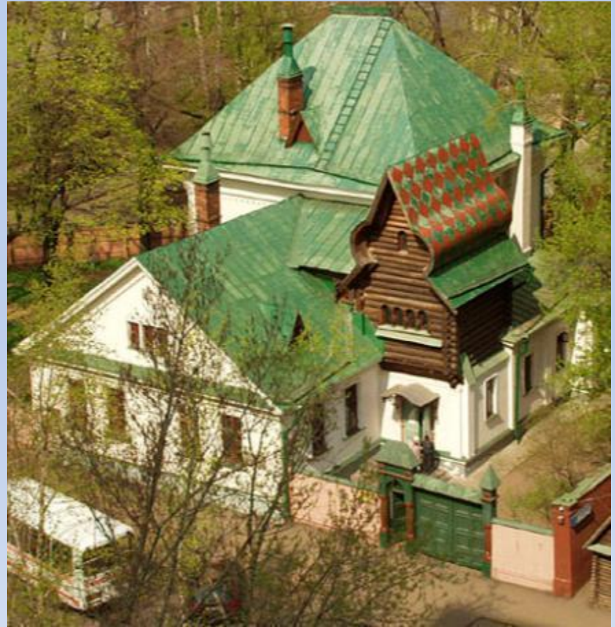
Дом-музей художника Васнецова

В Дмитровском районе более 200 объектов историко-культурного наследия., среди них усадьбы Ольгово, Горки, Даниловское, Храброво, дом-музей Васнецова.