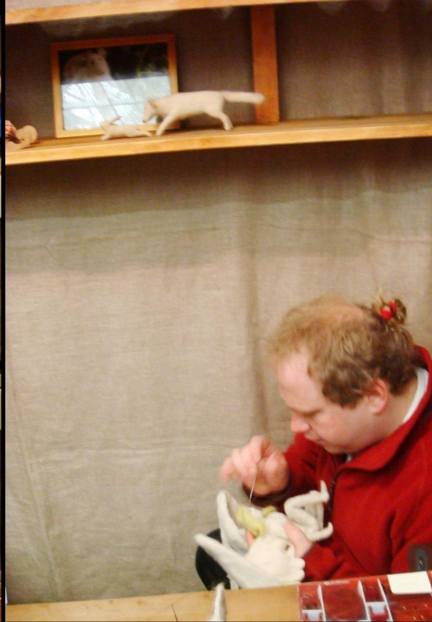
Поведение стендистов – пассивное, но дружелюбное