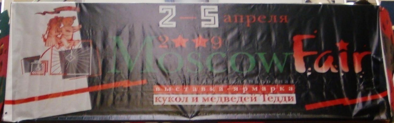
Московская международная выставка-ярмарка кукол и медведей Тедди