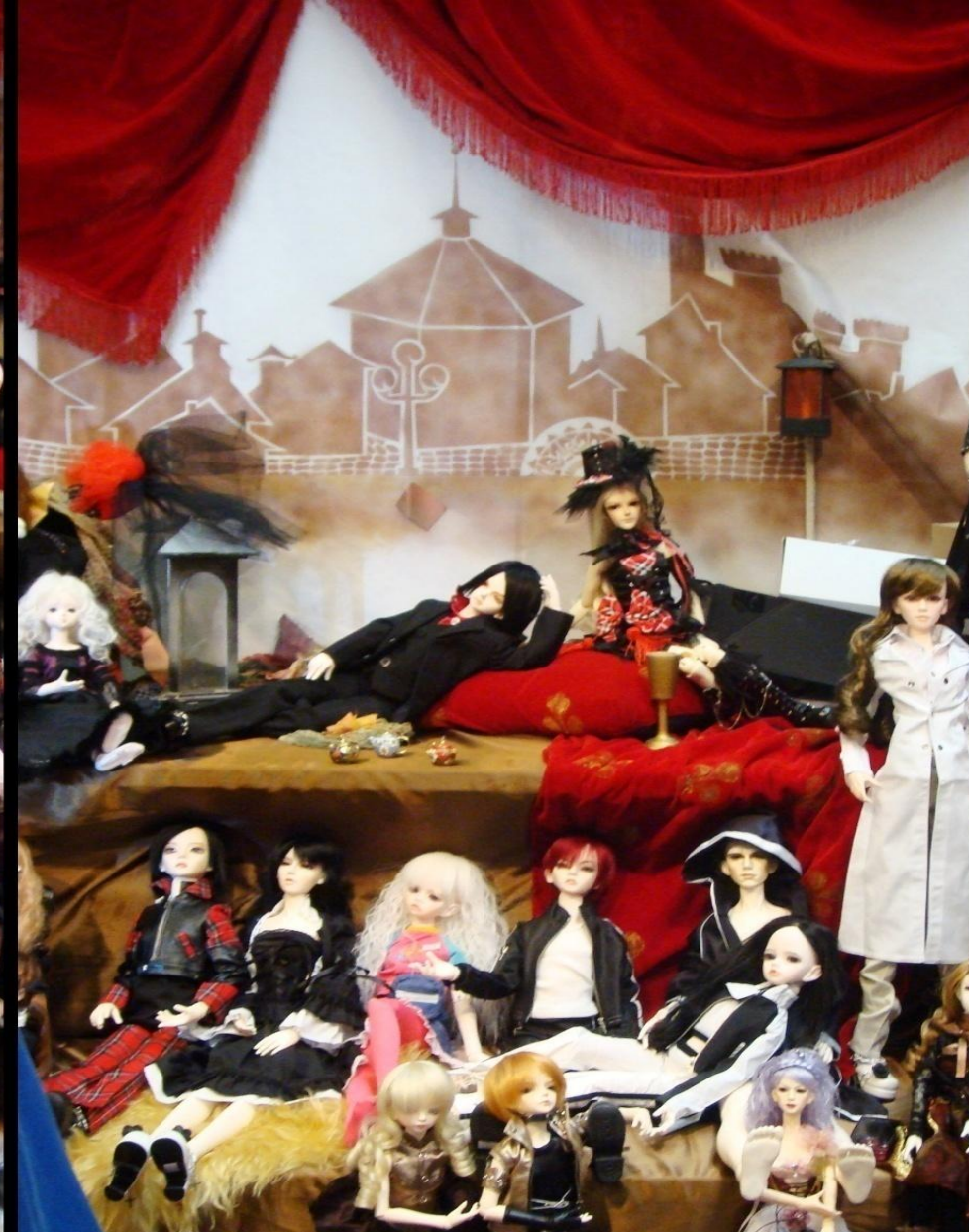
Корейские шарнирные куклы