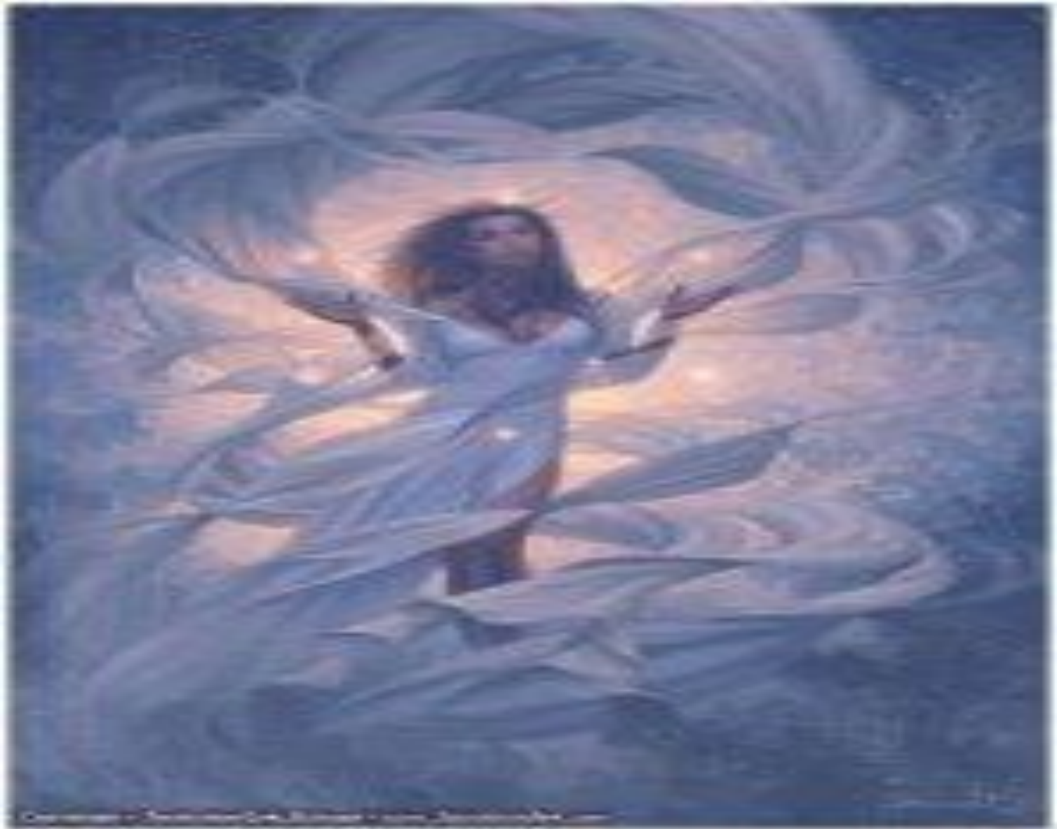
Неканената гостенка пристигна