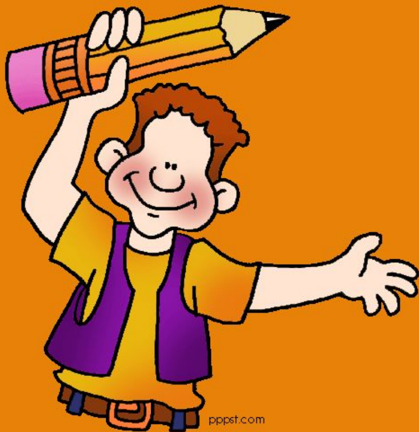
График на учебното време за учебната 2010/2011 година: