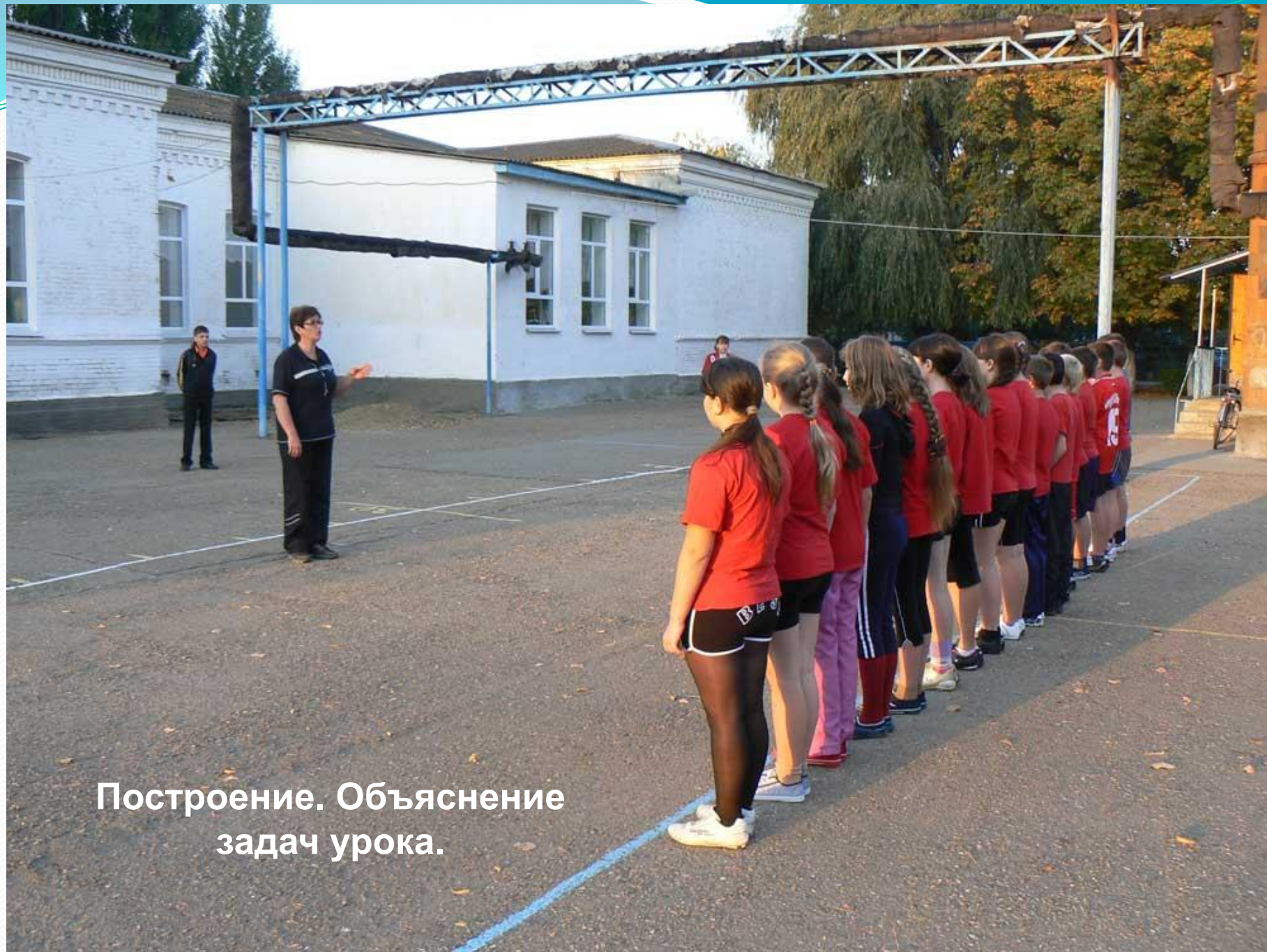
Построение. Объяснение задач урока.