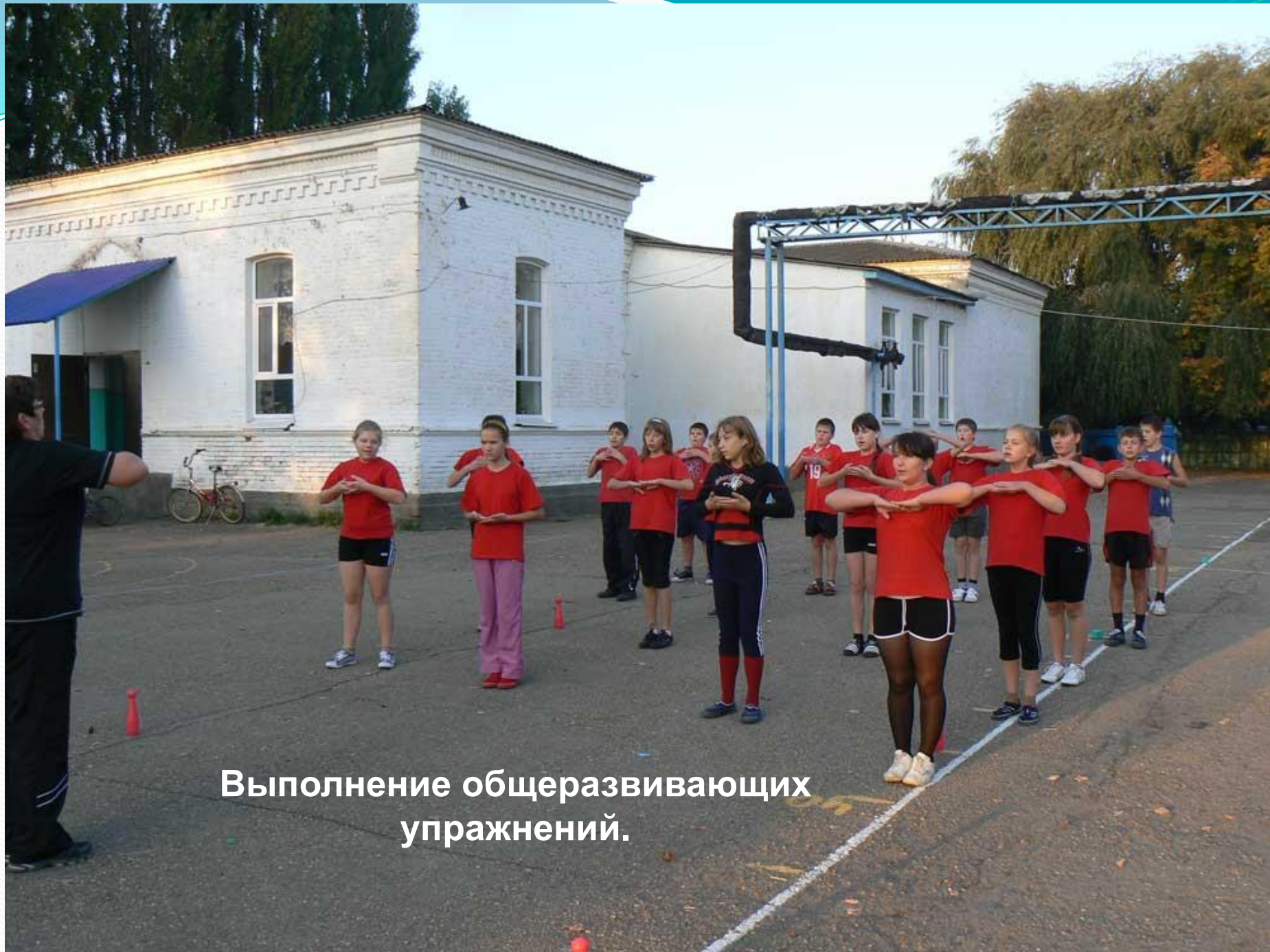
Выполнение общеразвивающих упражнений.