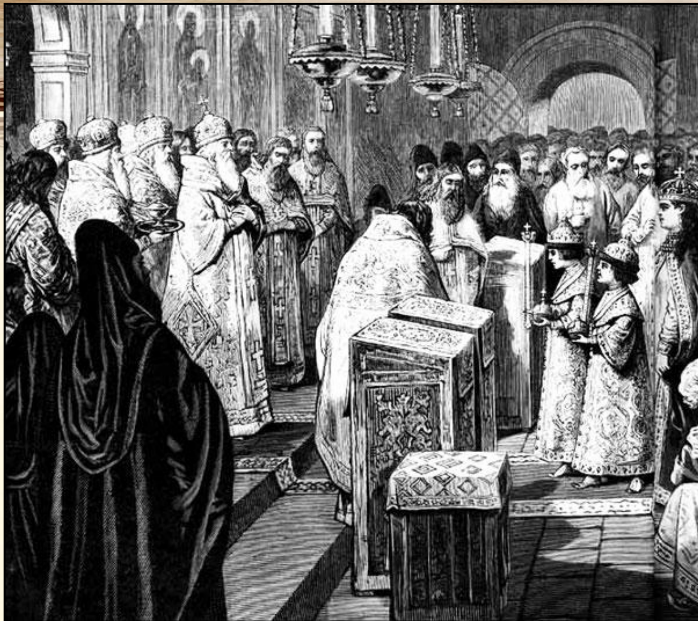
Цари и великие князья Иван V и Петр I