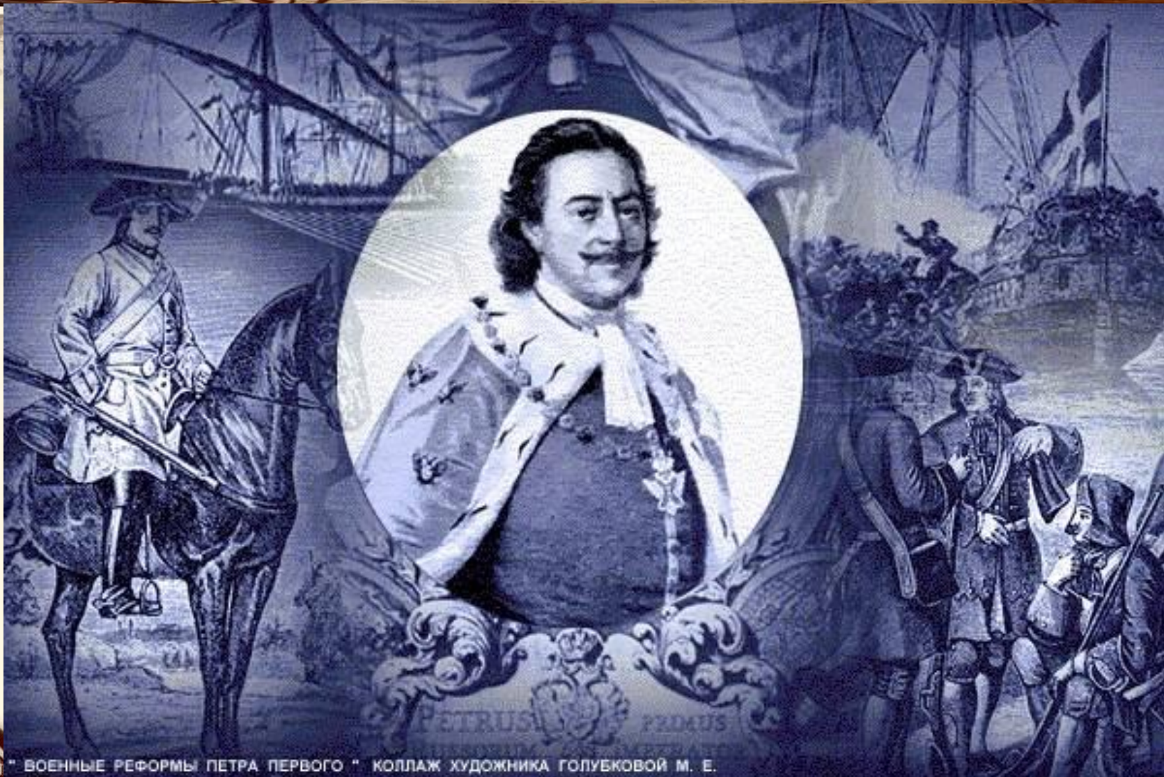
http://a " ВОЕННЫЕ РЕФОРМЫ ПЕТРА ПЕРВОГО " КОЛЛАЖ ХУДОЖНИКА ГОЛУБЕКОВОЙ М. Е.