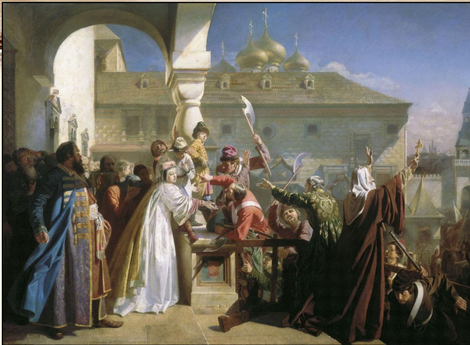
Н. Дмитриев-Оренбургский Стрелецкий бунт