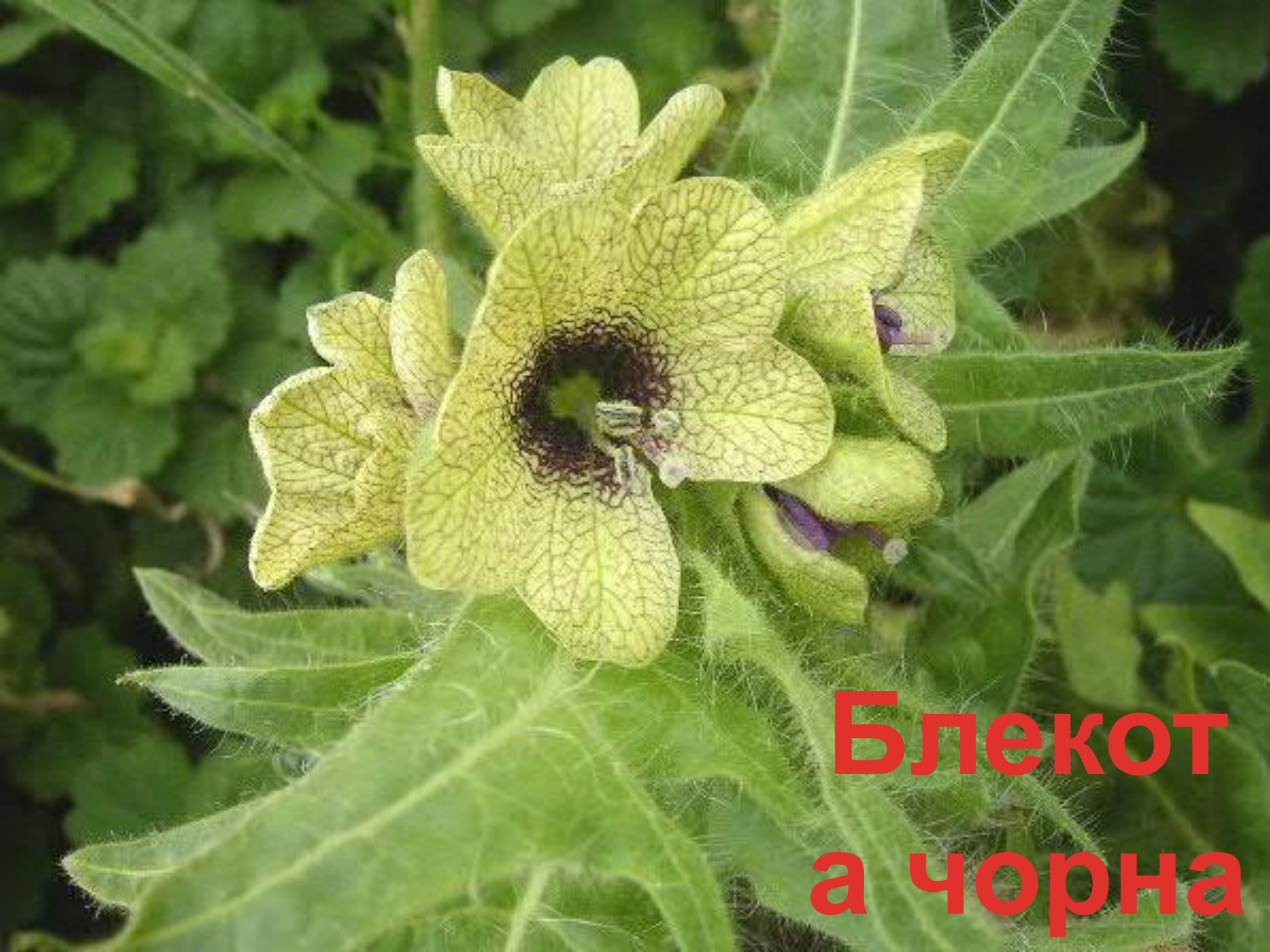
Блекот а чорна