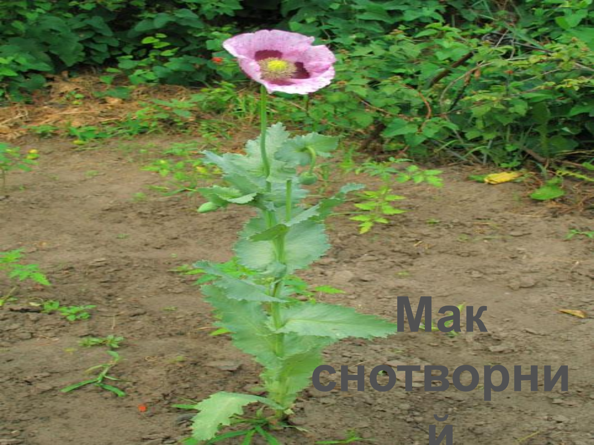
Мак снотворни й