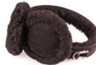
shearling "double u"