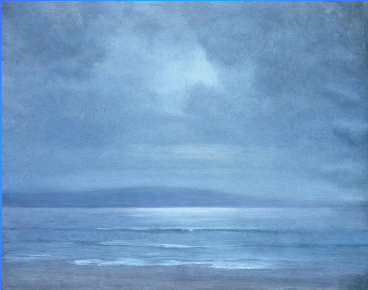
Море. Бумага, масло. 25 х 31.