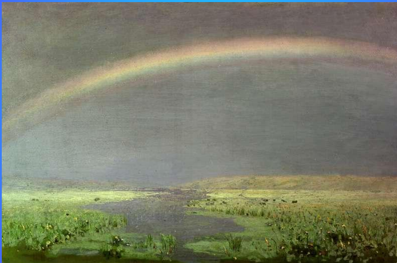
Радуга. 1875-1879 гг. б. на к., м., 20 x 310