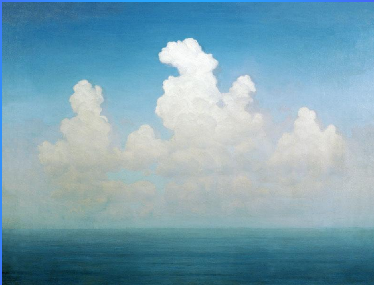
Облако 1895. Холст, масло. 41 x 53.