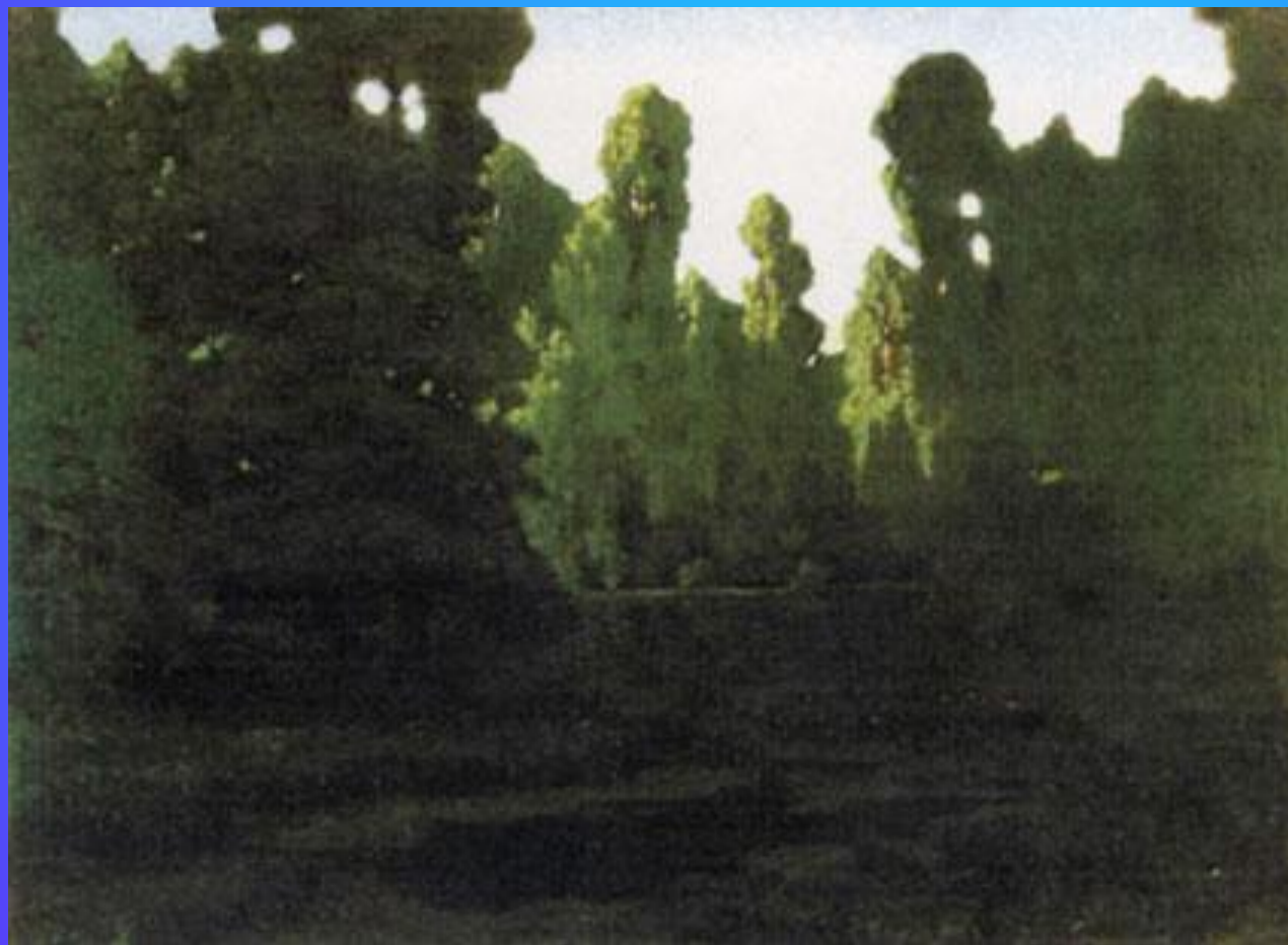
Лес. 1890-е гг. Х.,б., м., 39 x 53