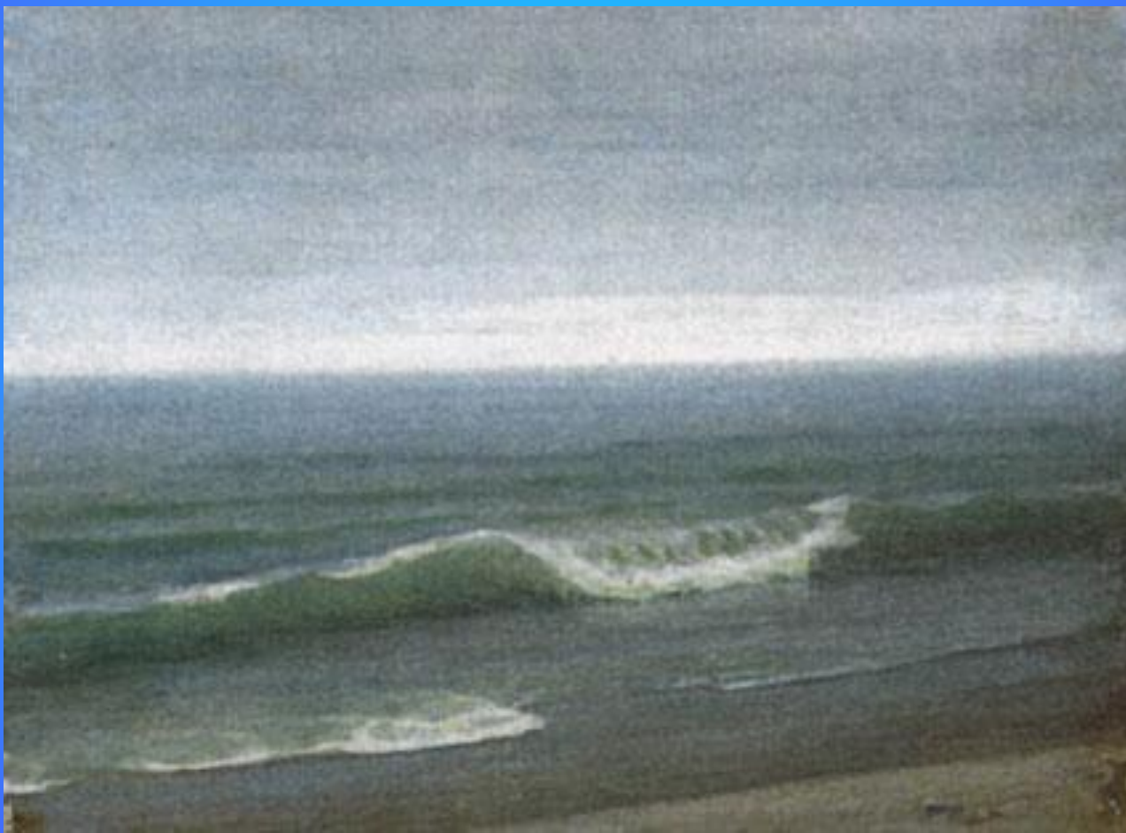
Море. Крым. (Этюд). 1875-1879 гг. б., м., 20 x 26