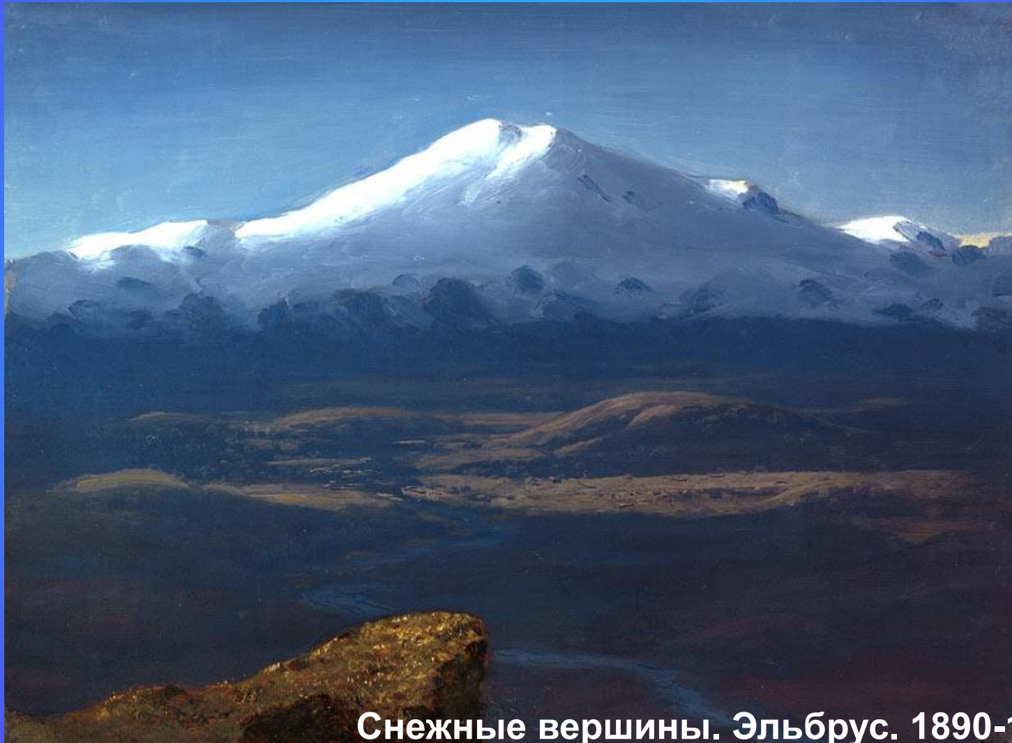
Снежные вершины. Эльбрус. 1890-1895 гг. б., м., 19 x 26,5