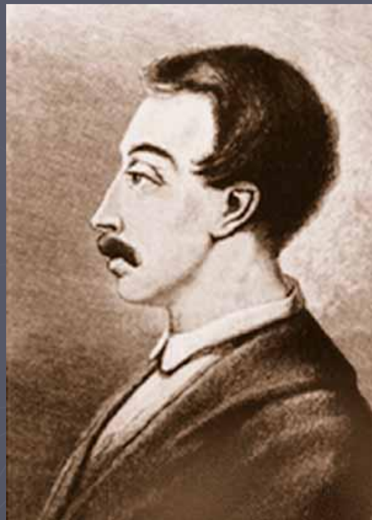
Кюхельбекер Вильгельм Карлович, лицейский друг Пушкина, декабрист

Я жду тебя, мой запоздалый друг, — Приди; огнём волшебного рассказа Сердечные преданья оживи; Поговорим о бурных днях Кавказа, О Шиллере, о славе, о любви.