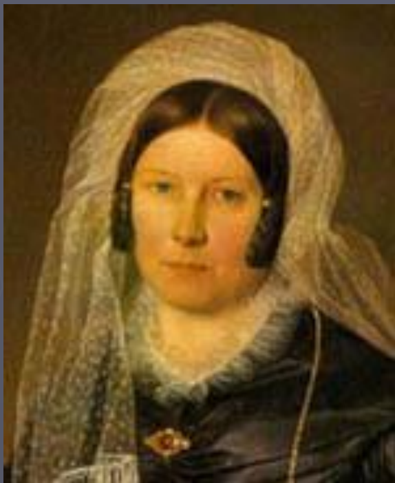
Екатерина Андреевна Карамзина