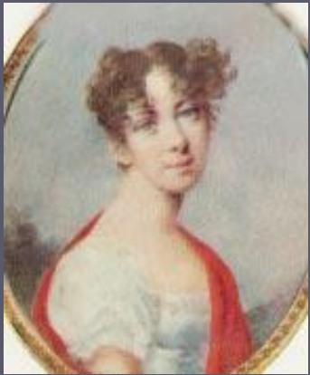
ВЕРА ФЕДОРОВНА ВЯЗЕМСКАЯ (1790—1886)

«Княгиня Вяземская говорит, что Пушкин был у них в доме как сын. Иногда, не заставая их дома, он уляжется на большой скамейке перед камином и дожидается их возвращения... С княгинею он был откровеннее, чем с князем... Накануне дуэли, вечером, Пушкин явился на короткое время к княгине Вяземской и сказал ей, что его положение стало невыносимо и что он послал Геккерену вторичный вызов...»