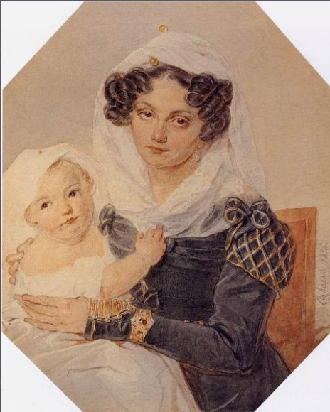
П Ф Соколов Портрет княгини М Н Волконской с сыном Николаем, 1826 г.