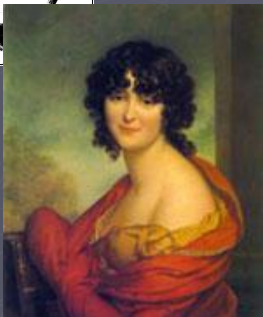
ЕВДОКИЯ ИВАНОВНА ГОЛИЦЫНА (1780—1850)

раев чужих неопытный любитель И своего всегдашний обвинитель, Я говорил: в отечестве моем Где верный ум, где гений мы найдем? Где гражданин с душою благородной, Возвышенной и пламенно свободной? Где женщина — не с холодной красотой, Но с пламенной, пленительной, живой? Где разговор найду непринужденный, Блистательный, веселый, просвещенный? С кем можно быть не холодным, не пустым? Отечество почти я ненавидел — Но я вчера Голицыну увидел И примирен с отечеством моим.