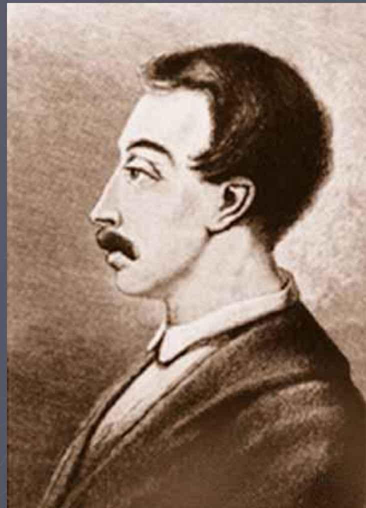
Кюхельбекер Вильгельм Карлович, лицейский друг Пушкина, декабрист

Я жду тебя, мой запоздалый друг, — Приди; огнём волшебного рассказа Сердечные преданья оживи; Поговорим о бурных днях Кавказа, О Шиллере, о славе, о любви.