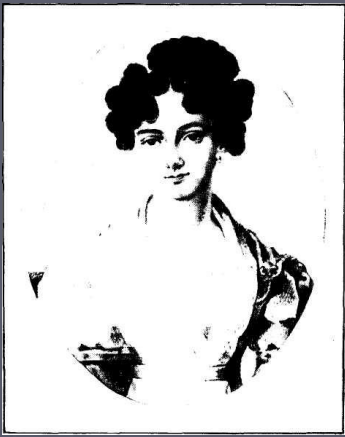
МАРИЯ НИКОЛАЕВНА ВОЛКОНСКАЯ (Раевская) (1805—1863)