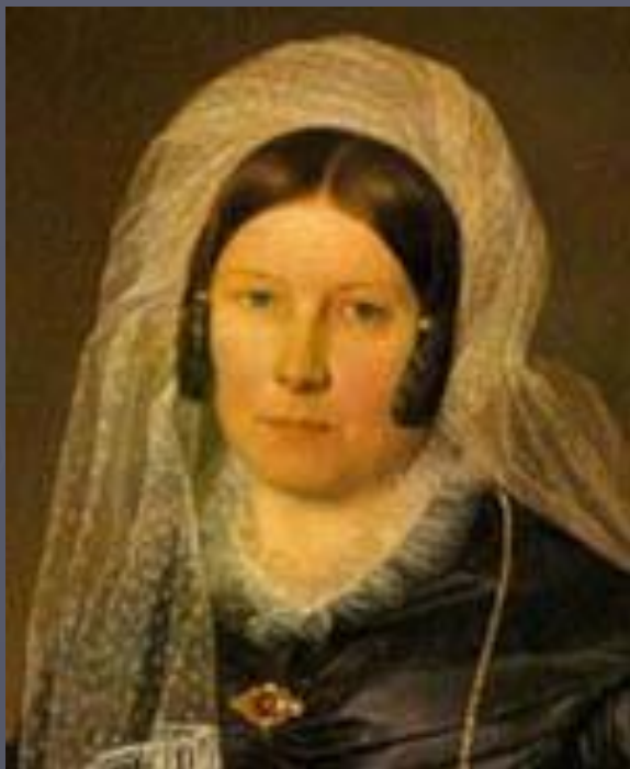
Екатерина Андреевна Карамзина