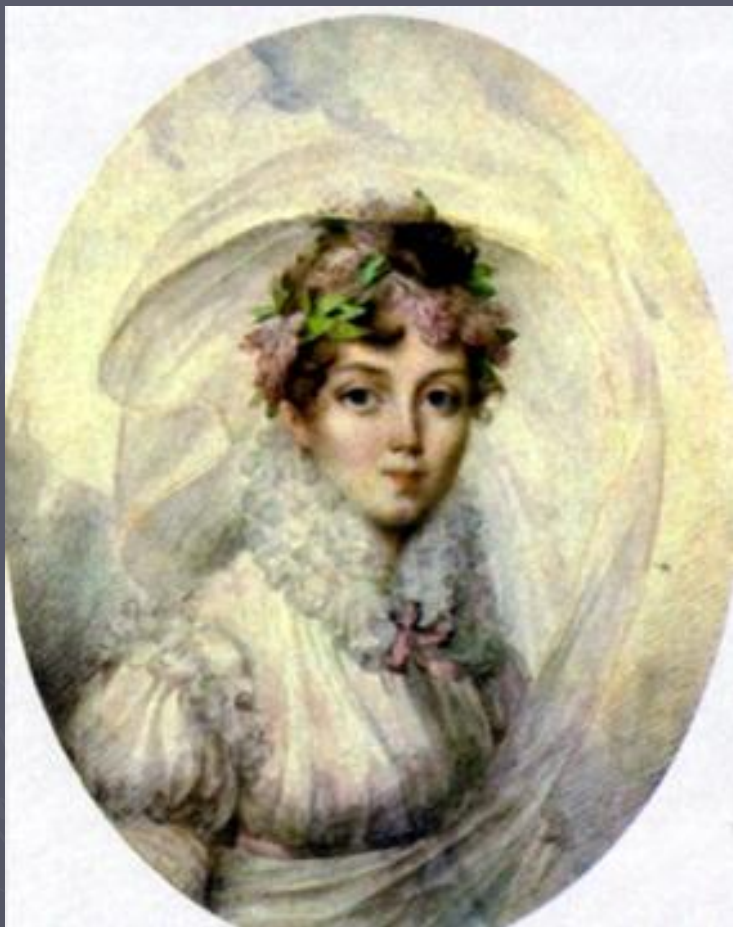
ЗИНАИДА АЛЕКСАНДРОВНА ВОЛКОНСКАЯ (1792—1862)

Среди рассеянной Москвы, При толках виста и бостона, При бальном лепете молвы Ты любишь игры Аполлона. Царица муз и красоты, Рукою нежной держишь ты Волшебный скипетр вдохновений, И над задумчивым челом, Двойным увенчанным венком, И вьется и пылает гений. Певца, плененного тобой, Не отвергай смиренной дани, Внемли с улыбкой голос мой, Как мимоездом Каталани Цыганке внемлет кочевой.