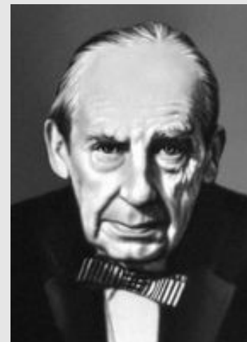
Гропиус Вальтер, дизайнер (1883 - 1969)