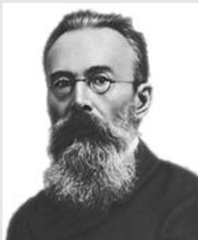
Н.А. Римский-Корсаков, композитор (1844 - 1908)