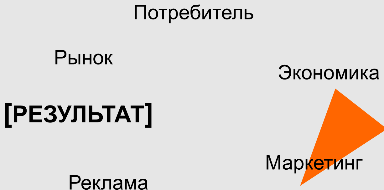
СХЕМА КРУГОВОЙ ЗАВИСИМОСТИ

Каждый элемент оказывает влияние на другие элементы.