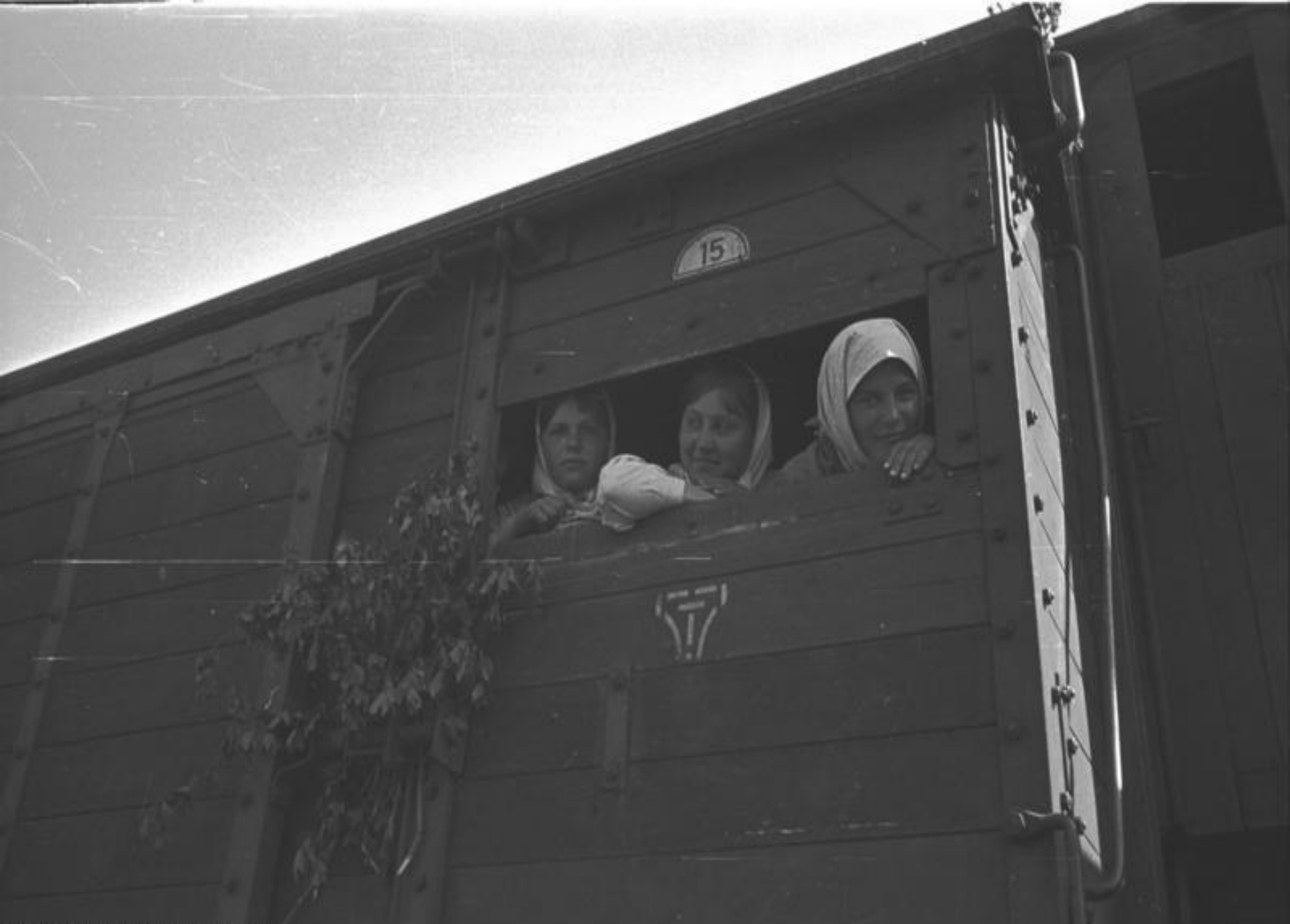
1942 Sommer