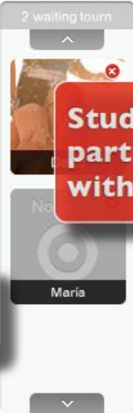
Students can participate with Webcam

Вебінар – це семінар, який проводиться в Інтернет відповідними програмними засобами