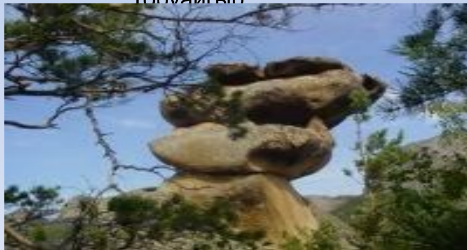
В окрестностях парка Баянаул