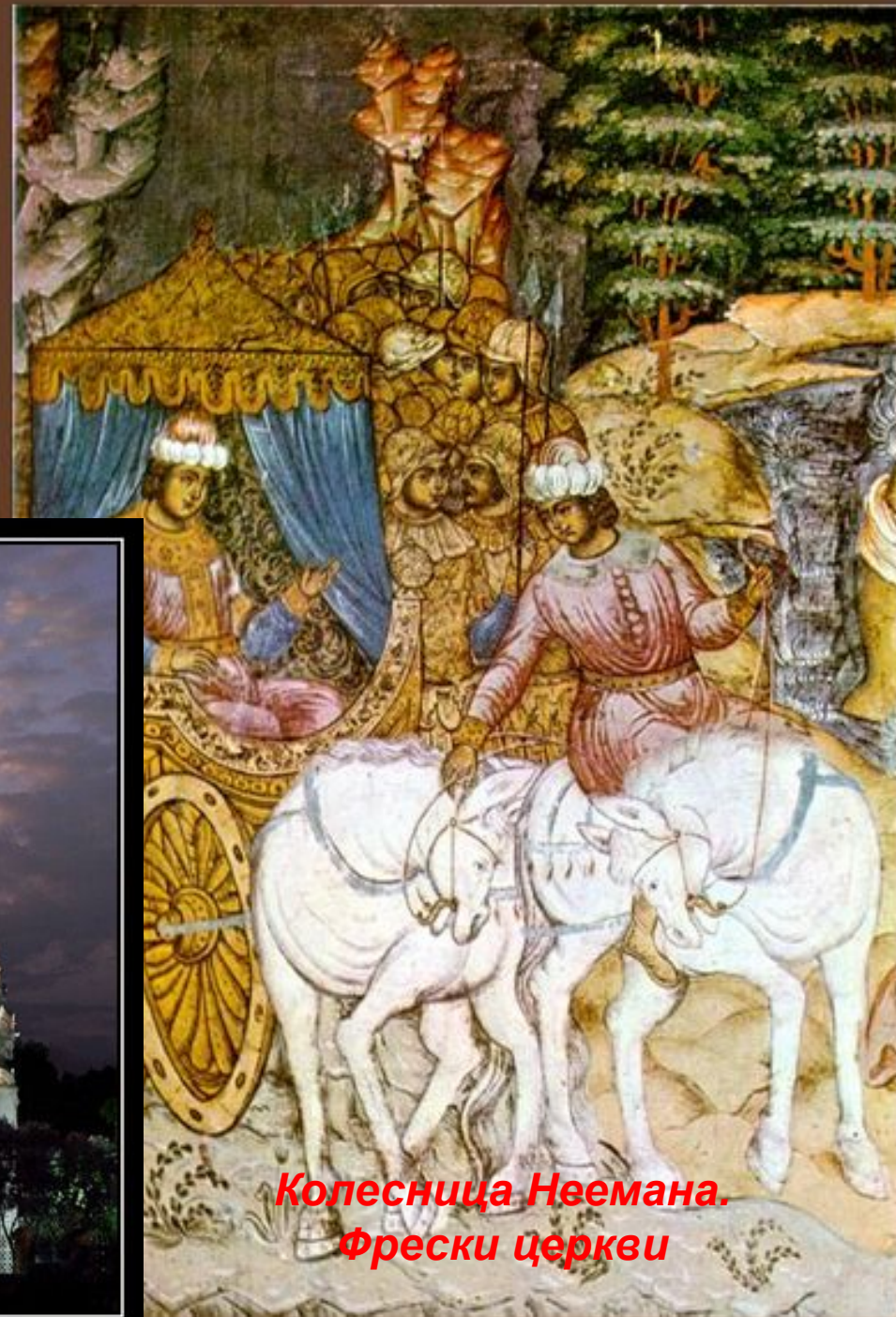
Колесница Неемана. Фрески церкви