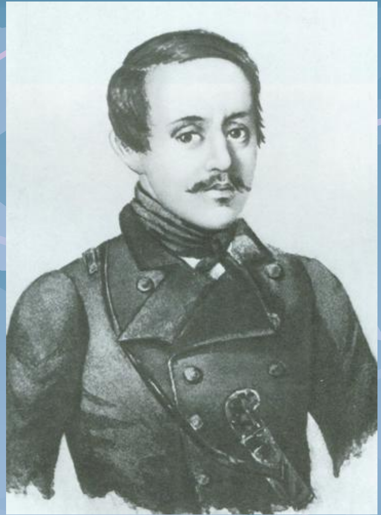
М. Ю. ЛЕРМОНТОВ Акварел К. А. Горбунов 1841 г.