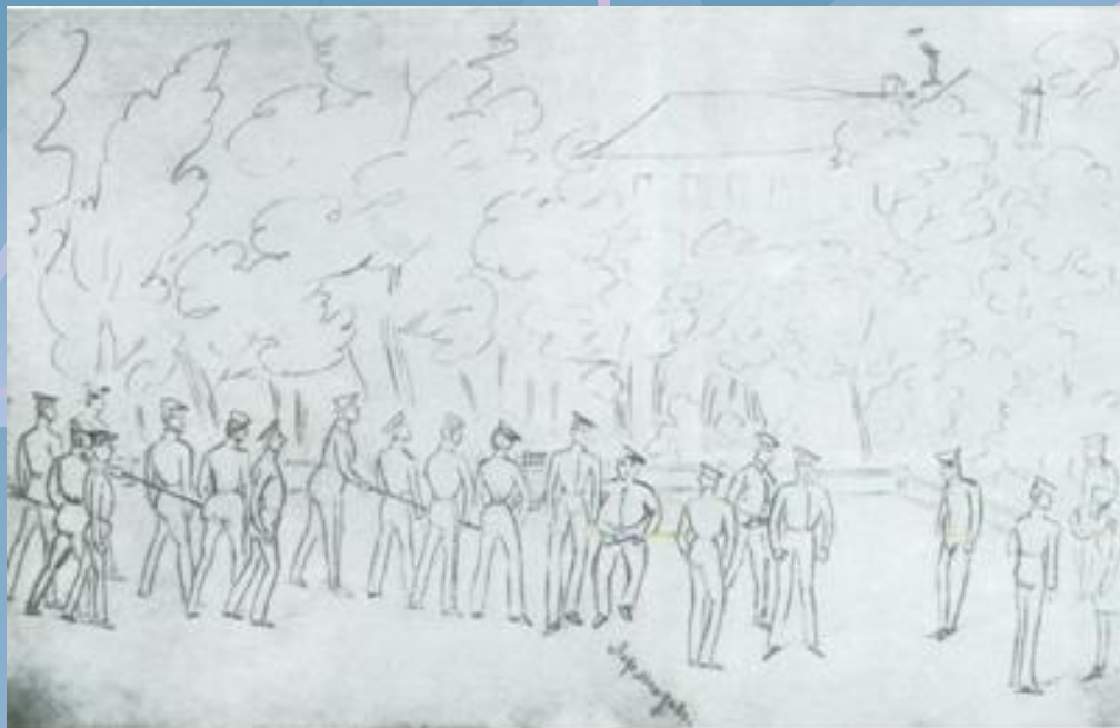
Маршировка на юнкерите Рисунка от албума на Л. Поливанов