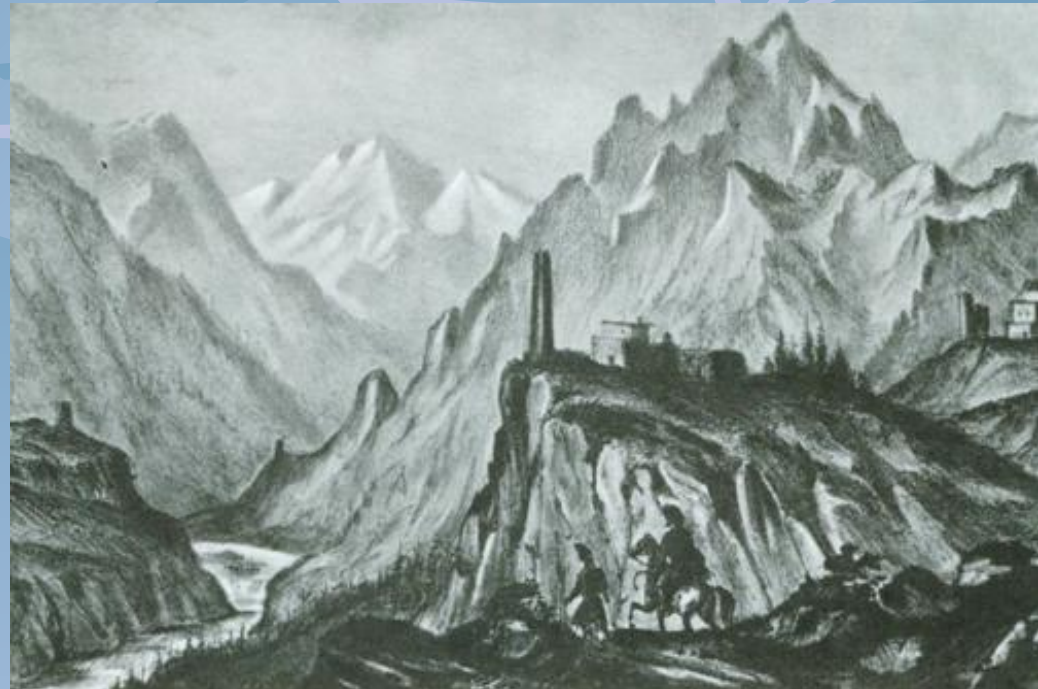
Крестова планина Автолитография на Лермонтов

Аз със сърцето си съм твой – винаги и навсякъде твой.