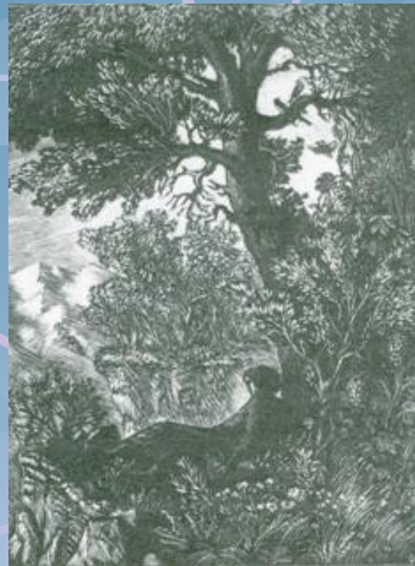
„МЦИРИ” - илюстрация