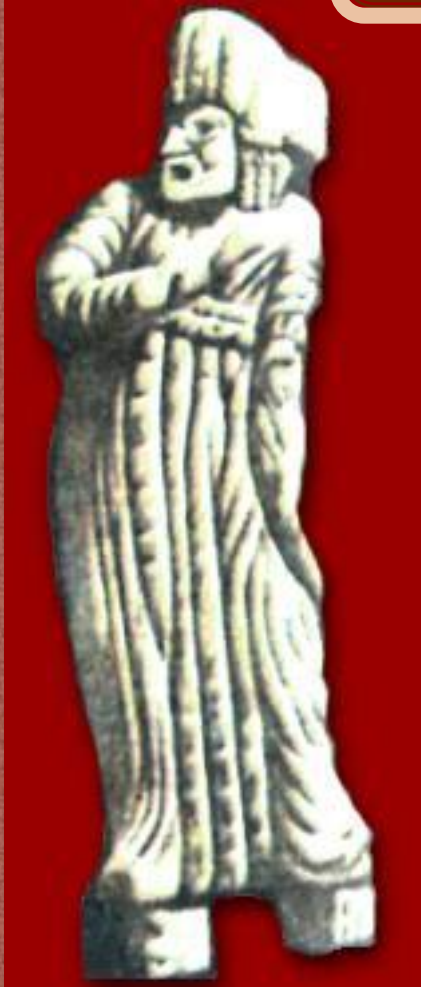
Актор Давньогрецька статуетка із слонової кістки