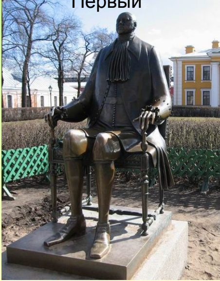
М. Шемякин. Пётр Первый