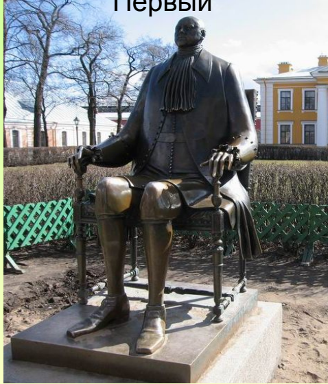
М. Шемякин. Пётр Первый