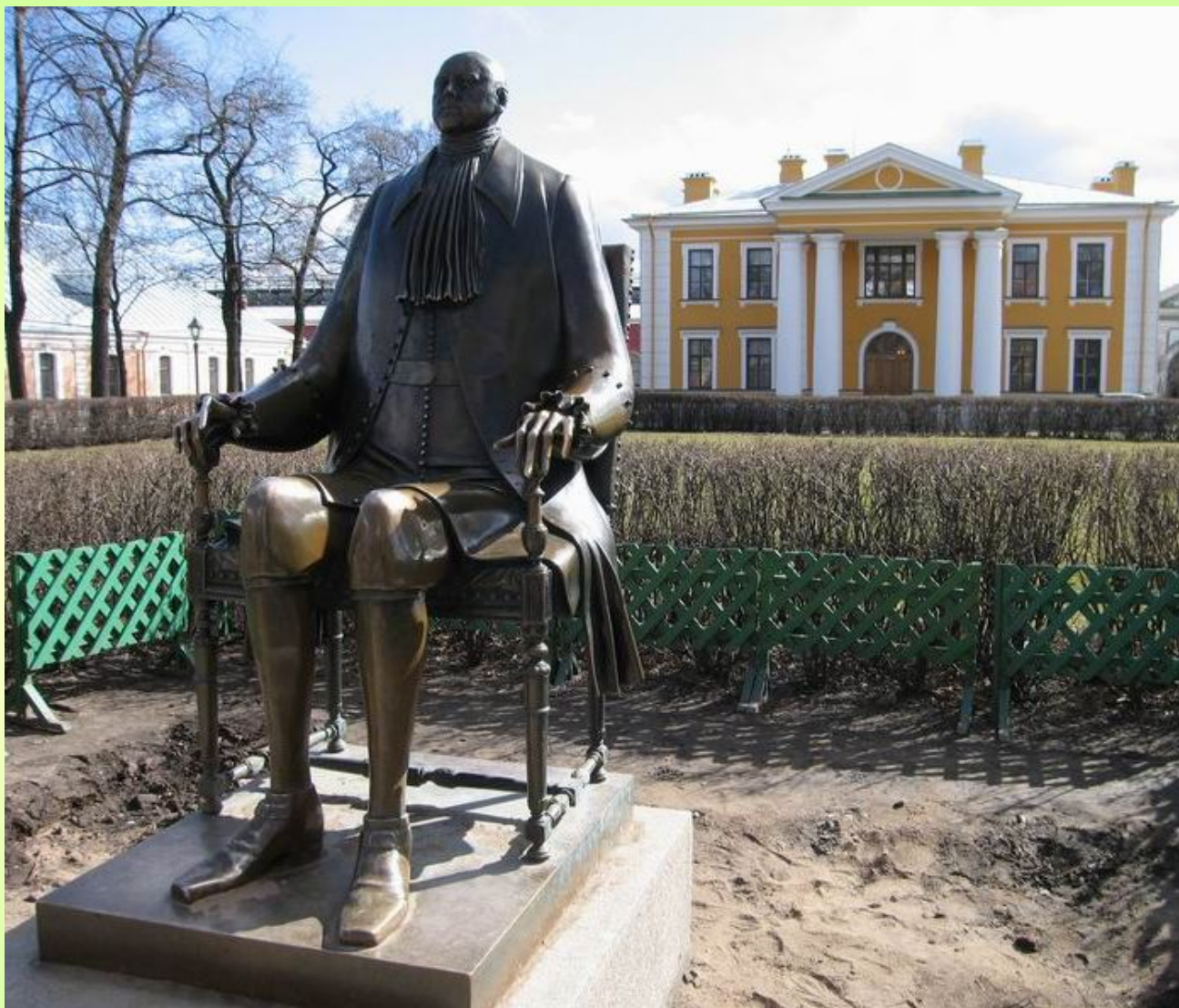
М. Шемякин. Пётр Первый