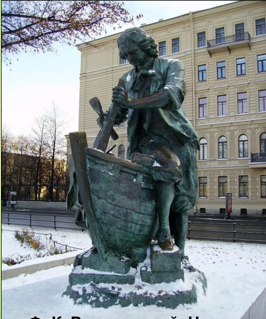
Ф. К. Романовский. Царь- плотник