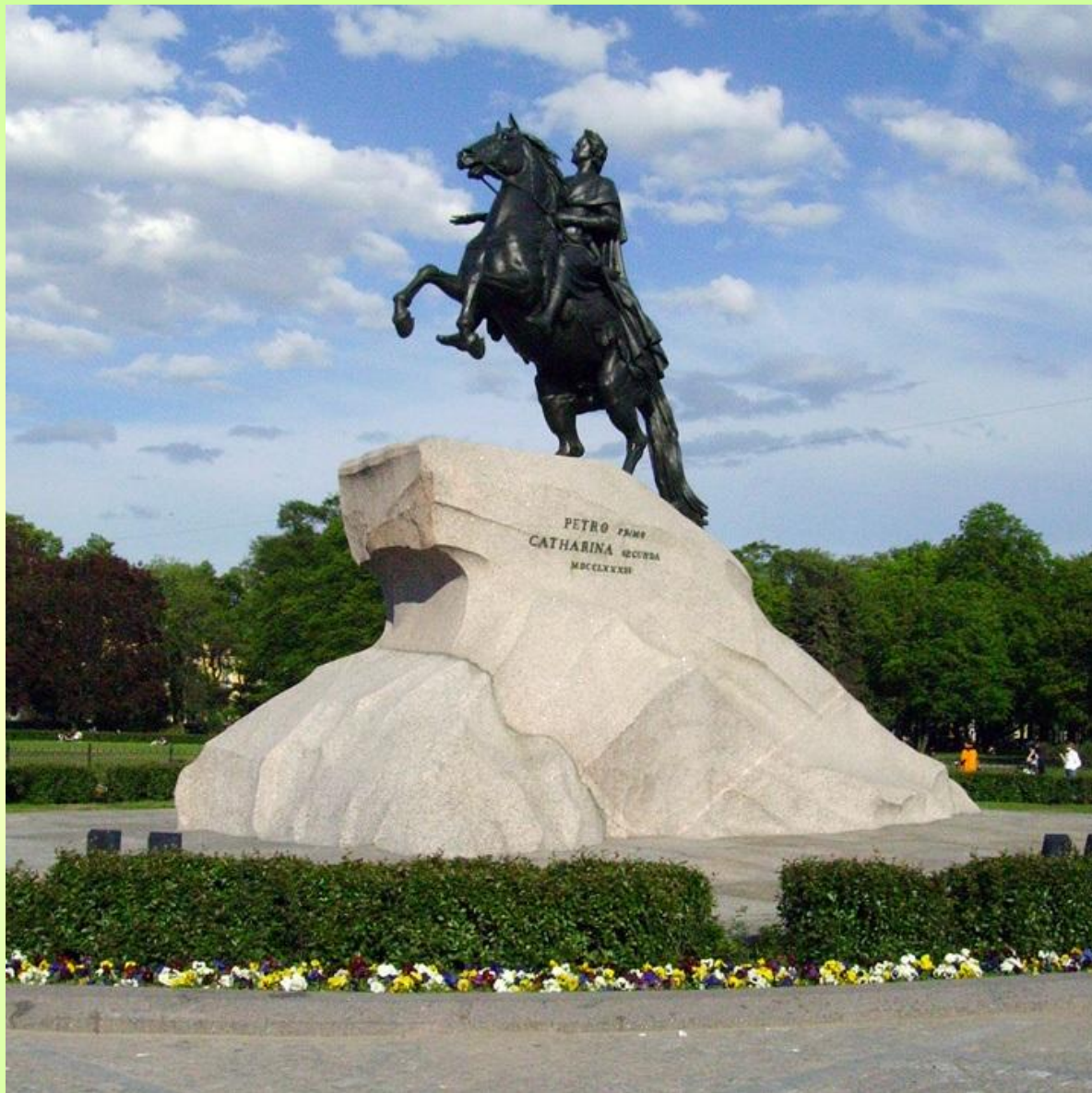
Э. Фальконе. Медный всадник