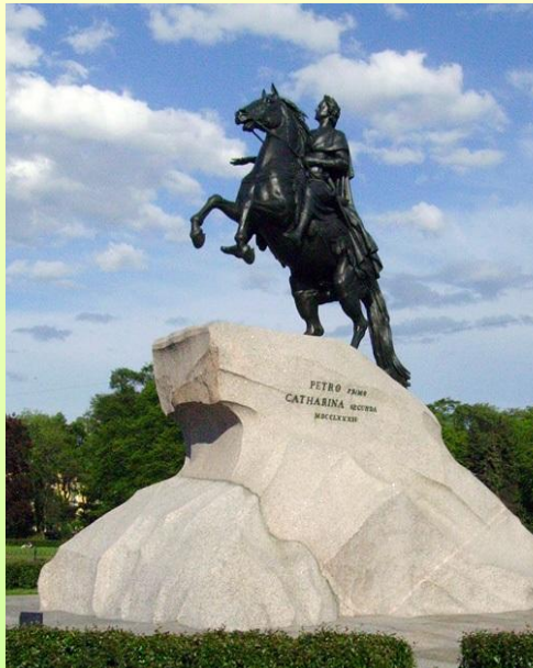
У. Фальконе. Медный всадник