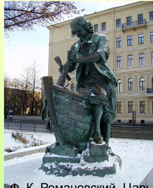
Ф. К. Романовский. Царь плотник