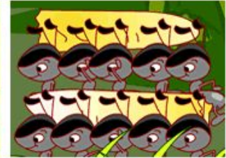
the black ants