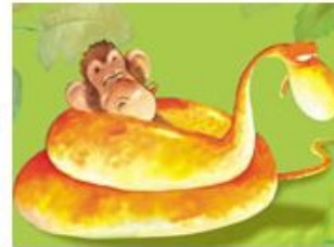
the boa and the monkey