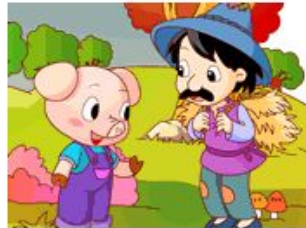
the three little pigs