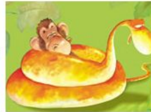
the boa and the monkey