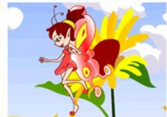
the three butterflies