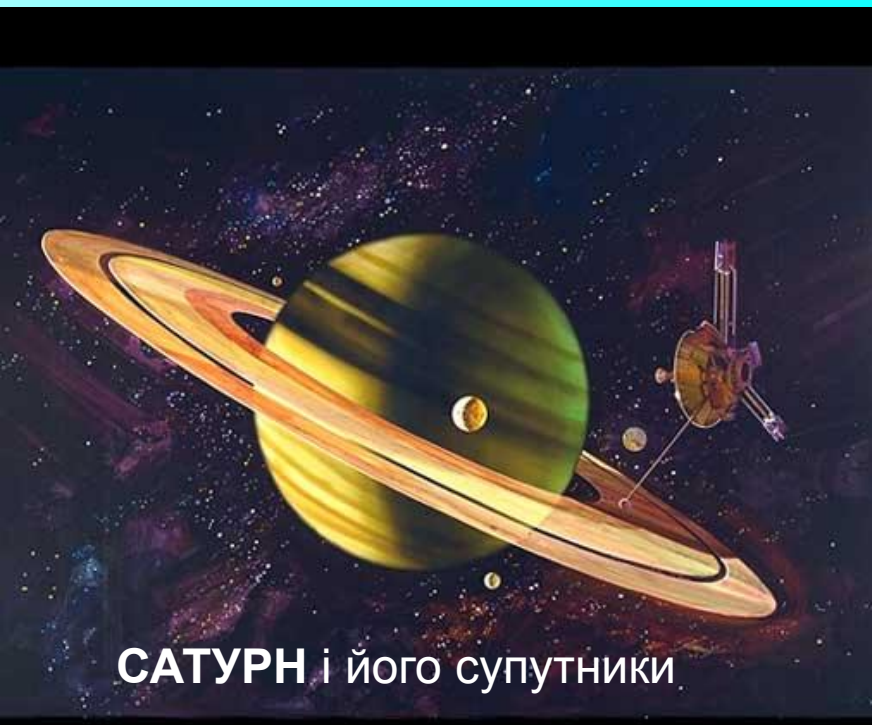
САТУРН і його супутники