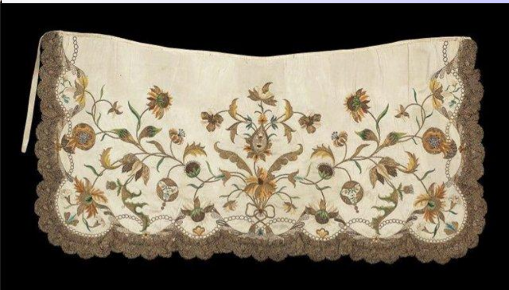
Отделка фартука декоративной вышивкой и кружевами.