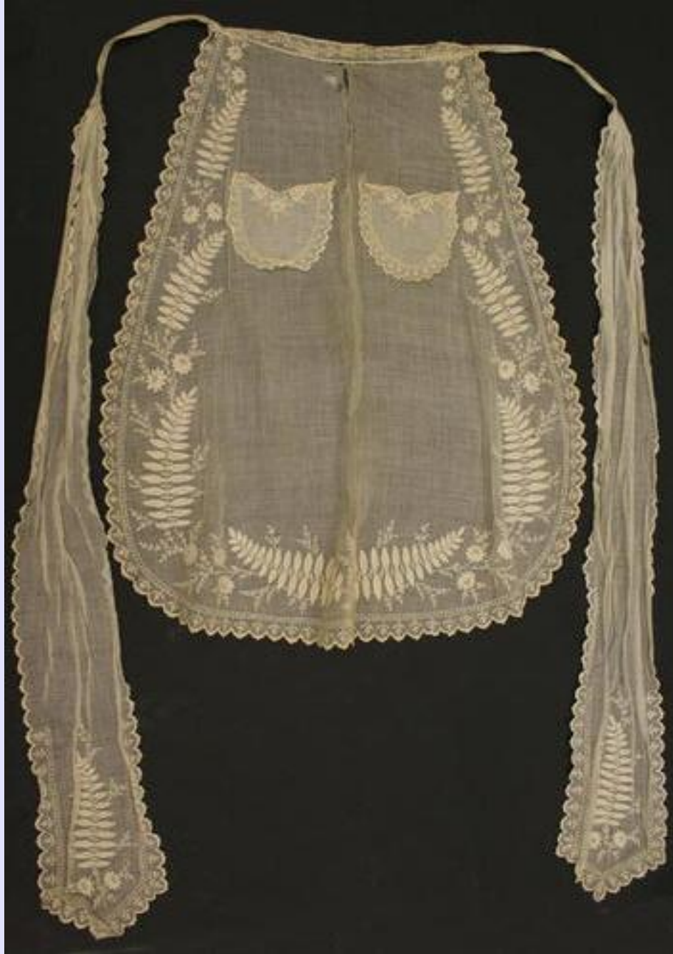
Фартук из тонкой ткани и вышивкой на поясе.