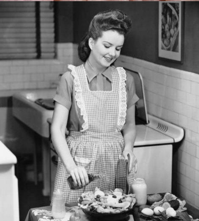
Современные варианты фартуков