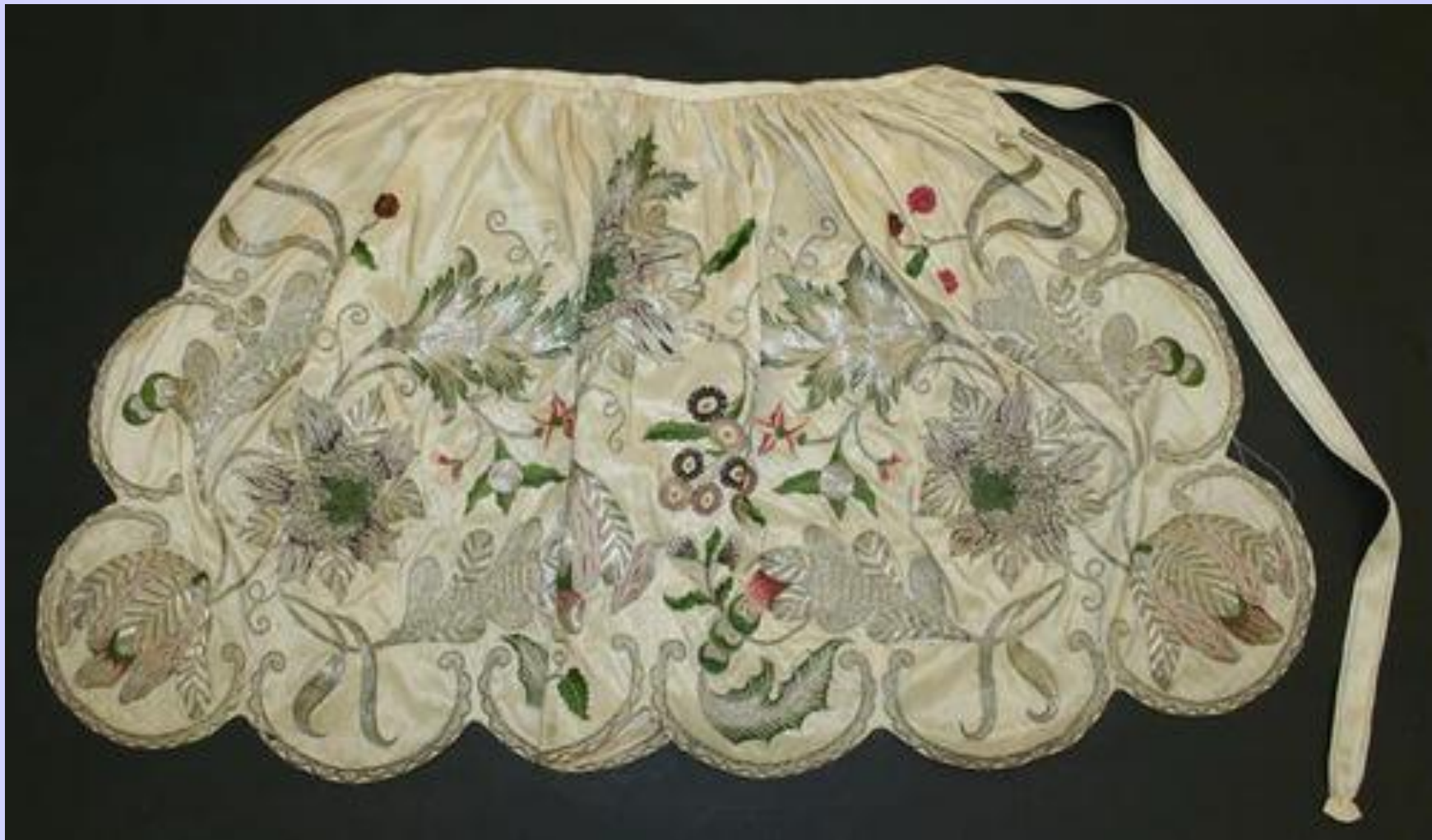
Фартук с фестонами и вышивкой.