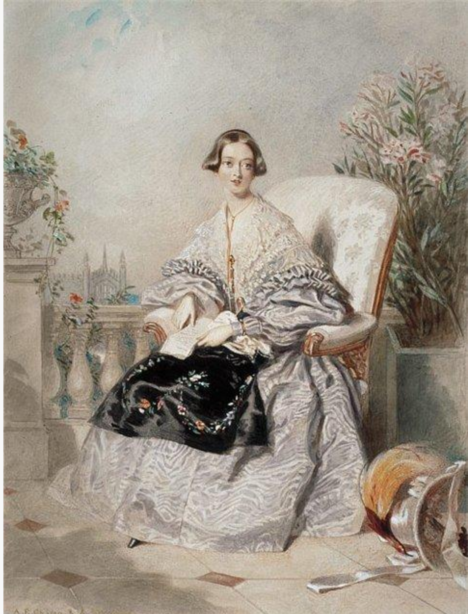
Фартук съемный, богато декорированный