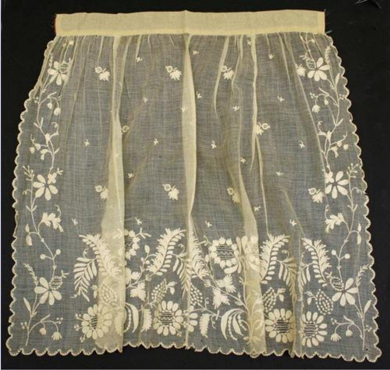
Фартук из нежной ткани, вышивка в тон.