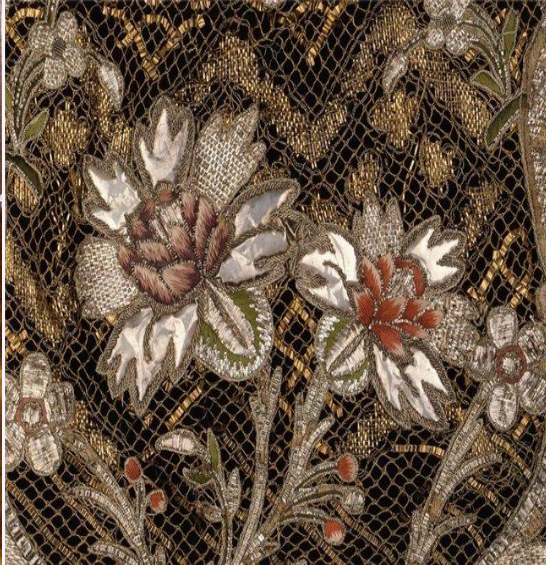
Фартук-украшение – кружевная вышивка шелком и металлической нитью.