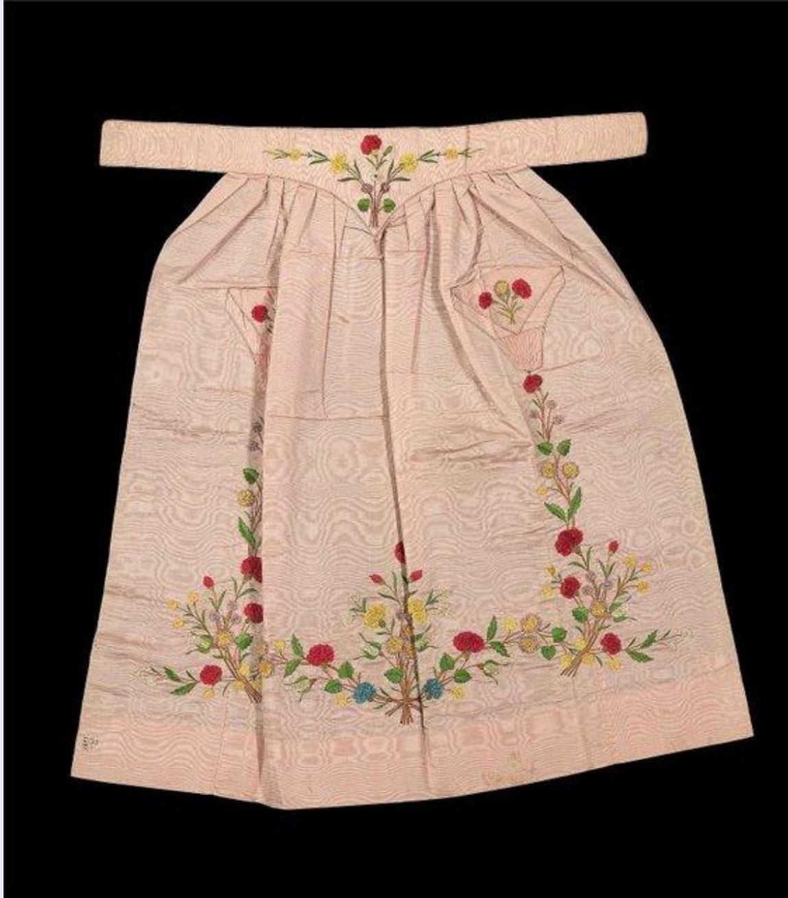
Фартук с фигурным поясом