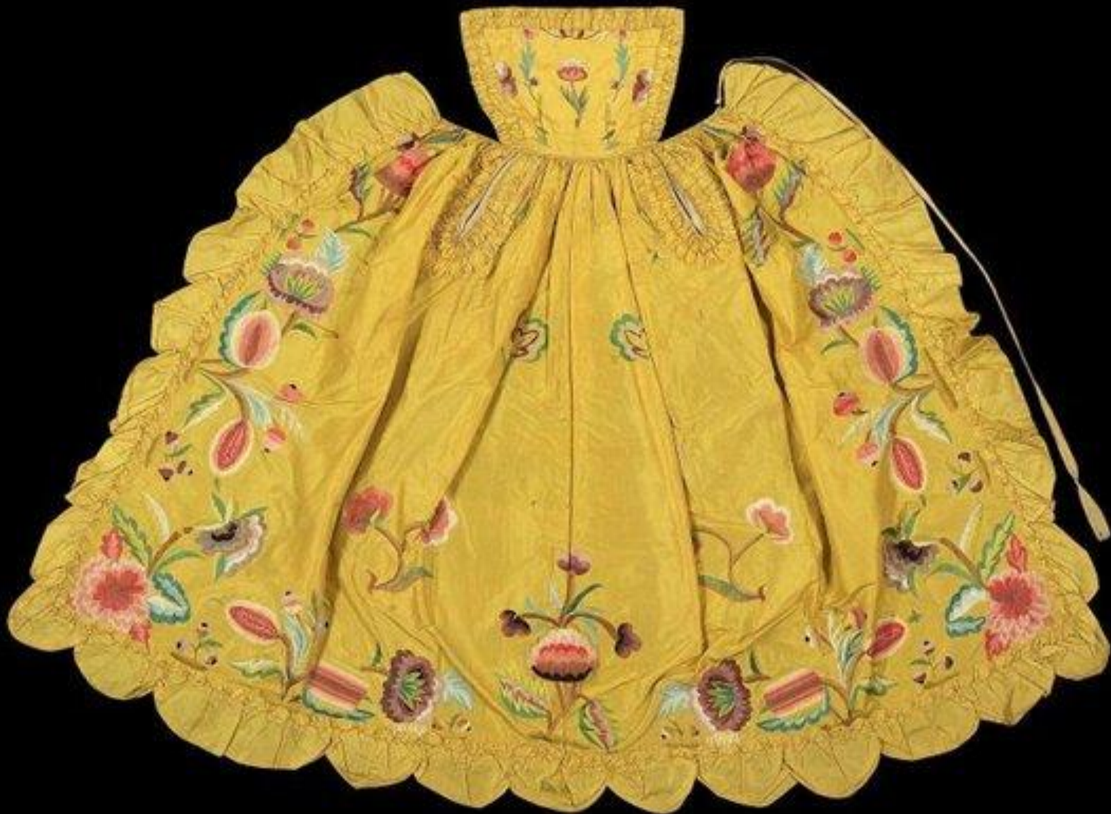
Фартук с грудкой с вышивкой и фестонами.