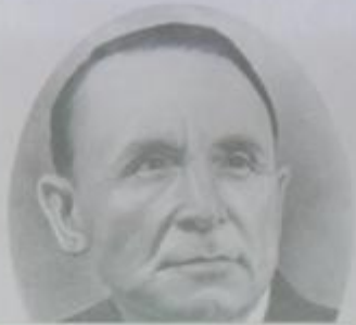
Халык күчеленең хәкиму