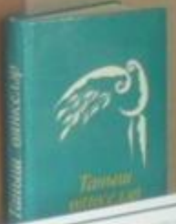
Иң һәрберһе һәм һәр берһе Әһәм һәм һәр һәм һәм Һәр һәм һәм һәм һәм Һәр һәм һәм һәм һәм — Җ. Җ. Җ.