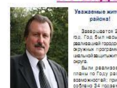
Уважаемые жители района!