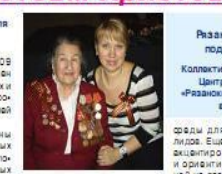
Уважаемые жители Рязанского района, ветераны, подрастающее поколение!

Здравствуй 2009 год. Год был не самым удачным для нашей страны, но мы все же сумели преодолеть трудности и выйти из кризиса. Мы хотим поздравить вас с наступающим Новым годом и Рождеством Христовым. Мы хотим пожелать вам крепкого здоровья, счастья и благополучия. Мы хотим выразить нашу благодарность вам за то, что вы сделали для нашей страны.