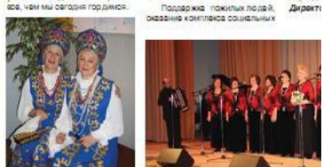
Поздравление пожилых людей, оказание комплекса социальных услуг.

Дорогие жители Рязанского района, ветераны войны и труда, люди старшего поколения! С 1990 года во всем мире по решению Генеральной Ассамблеи Организации Объединенных Наций 1 октября отмечается День пожилого человека. В этот день принято оказывать внимание и поддержку старшему поколению, но это лишь малая доля добродетели, которую вы заслужили своим созданием. Мы хотим поздравить вас с этим днем, пожелать вам крепкого здоровья, мудрости и оптимизма. С детства привыкая к культуре и мудрости, основы которой заложены в культуре и родной земли. Именно вы - наши читатели, наши гости, наши друзья - создавали и создавали неоспоримые успехи, чем мы сегодня гордимся.