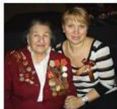
Уважаемые жители Рязанского района, ветераны, подрастающее поколение!

Коллектив Государственного учреждения «Рязанский» от всего сердца поздравляет вас с Новым 2010 годом.