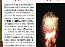
Зажигание ОДП Д.М. АЛЬБЕРТОВА-ОРЛОВА.

Праздник в поселке в честь Дня города. В программе танцевальная программа и фольклорный концерт. В этот день принято оказывать внимание и поддержку старшему поколению, но это лишь малая доля добродетели, которую вы заслужили своим созданием. Мы хотим поздравить вас с этим днем, пожелать вам крепкого здоровья, мудрости и оптимизма. С детства привыкая к культуре и мудрости, основы которой заложены в культуре и родной земли. Именно вы - наши читатели, наши гости, наши друзья - создавали и создавали неоспоримые успехи, чем мы сегодня гордимся.