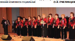
(Описание на стр. 4)