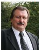
Уважаемые жители района!

Закрепился 2009 год. Год был насыщеннейший городскими и окружными программами социальной защиты жителей округа.