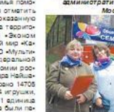
Уважаемые жители Рязанского района!