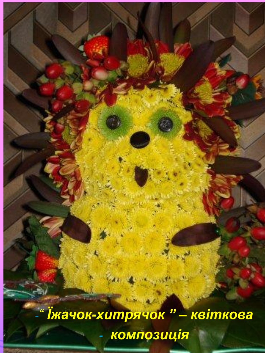
- “Іжачок-хитрячок” – квіткова композиція