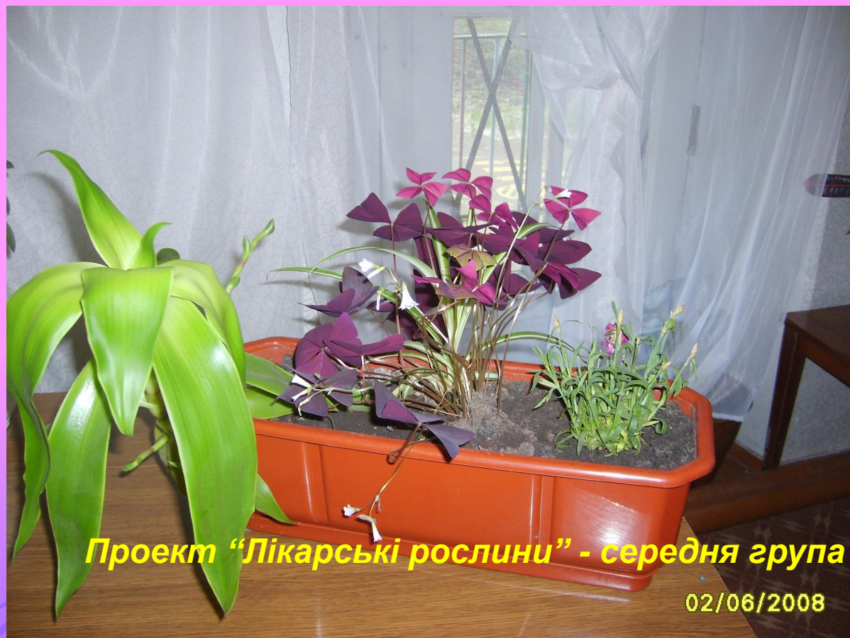
Проект "Лікарські рослини" - середня група

Лікарські рослини можна вирощувати не лише на городі чи у квітнику, але і в куточку природи, композиційно оформивши їх у стилі «Пен-трей». Знання дітей базуються, в першу чергу, на рослинному світі України