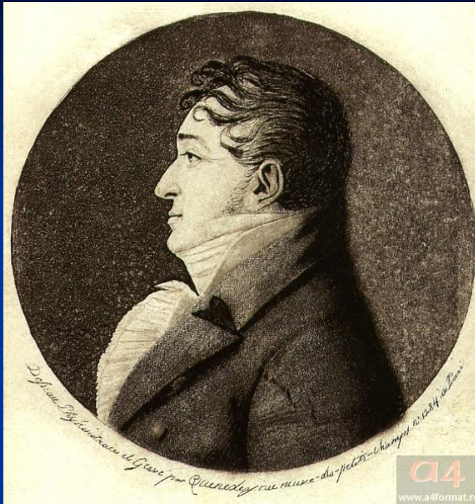
Василий Львович Пушкин