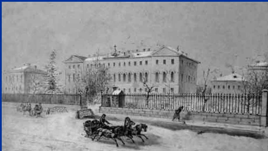
Императорский Александровский Лицей . Середина XIX века. Литография неизвестного художника

Поначалу лицей был задуман для воспитания своих младших братьев - Николая и Михаила, совместно с детьми знатных фамилий.