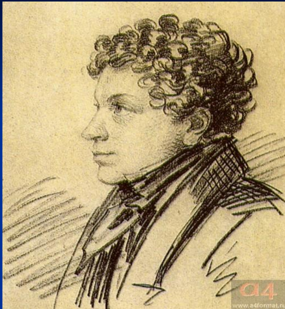
Лев Сергеевич Пушкин