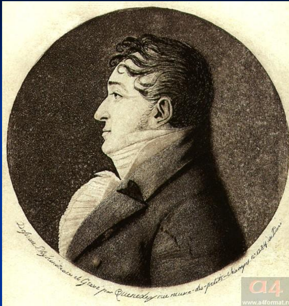
Василий Львович Пушкин