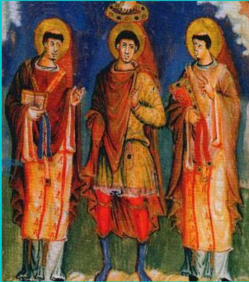
Коронование Карла Лысого.