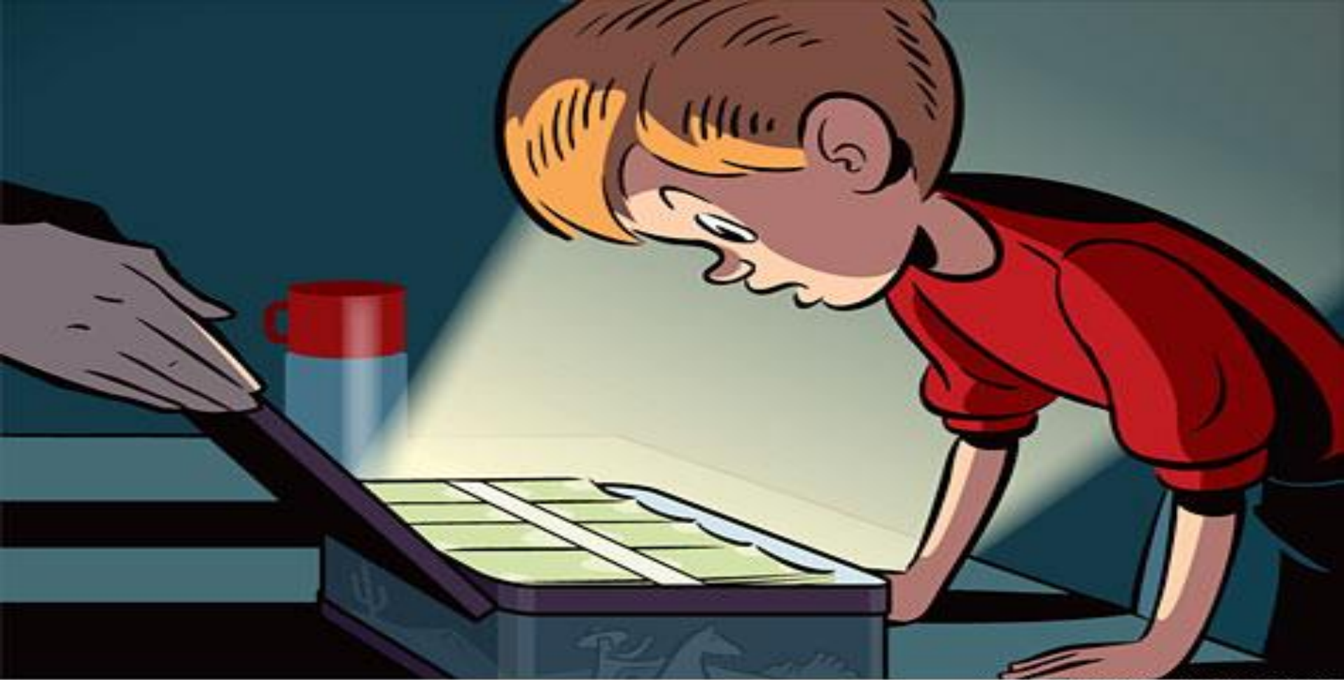
ILLUSTRATION: MARK MATCHO

Нерозподілений прибуток - основне джерело нагромадження майна підприємства чи організації. Це частина валового прибутку, що залишилася після сплати податку на прибуток у бюджет і відволікання засобів за рахунок прибутку на інші цілі.