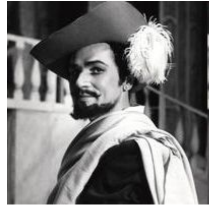
Георг Отс (1920-1975) эстонский оперный певец