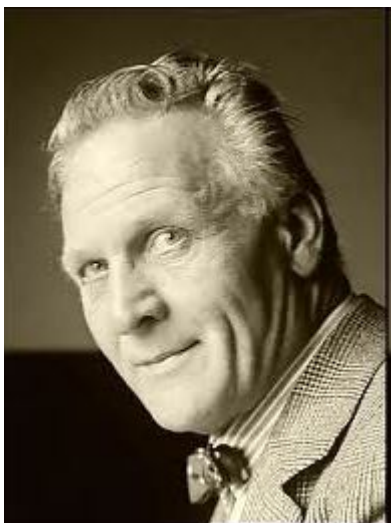
Фёдор Шаляпин (1873-1938) русский оперный певец