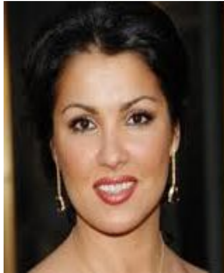
Анна Нетребко род.1942 – русская оперная певица