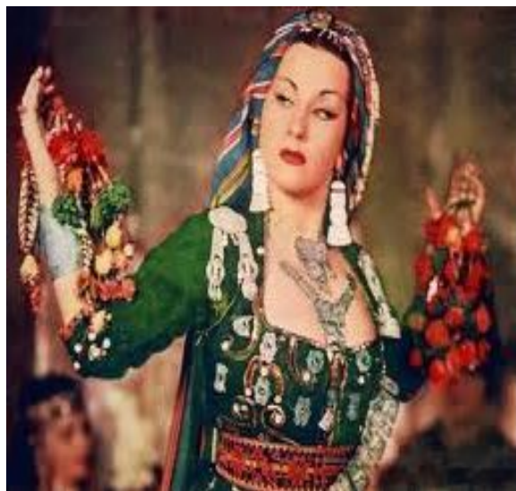
Yma Sumac (1922-2008) – перуанская оперная певица и актриса (5 октав)