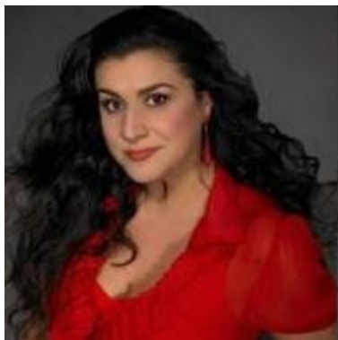
Чечилия Бартоли род. 1966 итальянская оперная певица