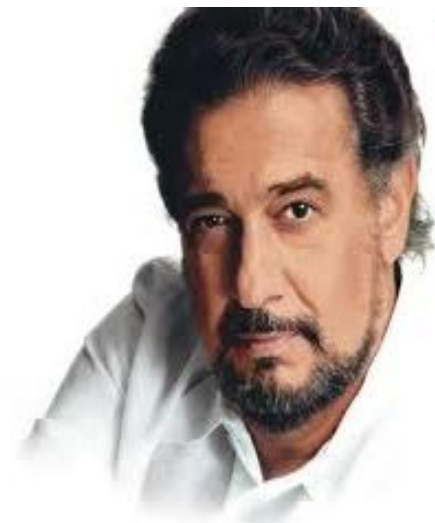
Пласидо Доминго род. 1941 испанский оперный певец