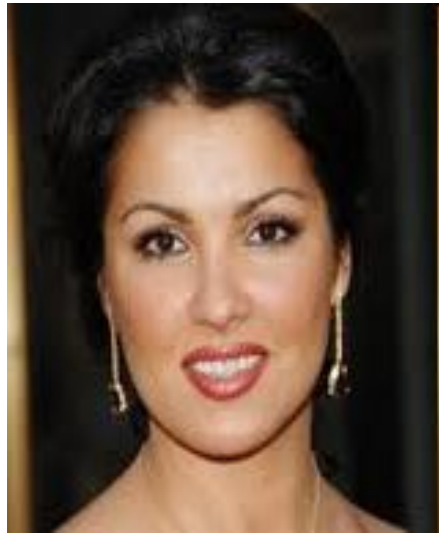
Анна Нетребко род.1942 – русская оперная певица