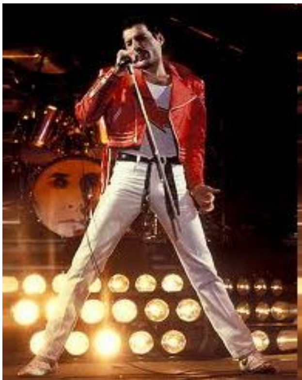
Freddie Mercury (1941-1996) британский рок-певец (3 октавы)