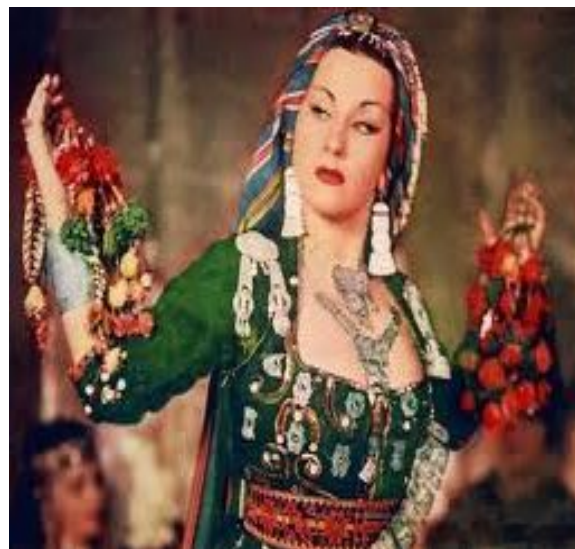
Yma Sumac (1922-2008) – перуанская оперная певица и актриса (5 октав)