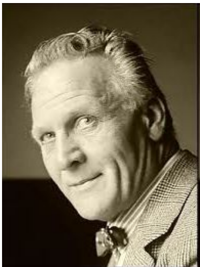
Фёдор Шаляпин (1873-1938) русский оперный певец