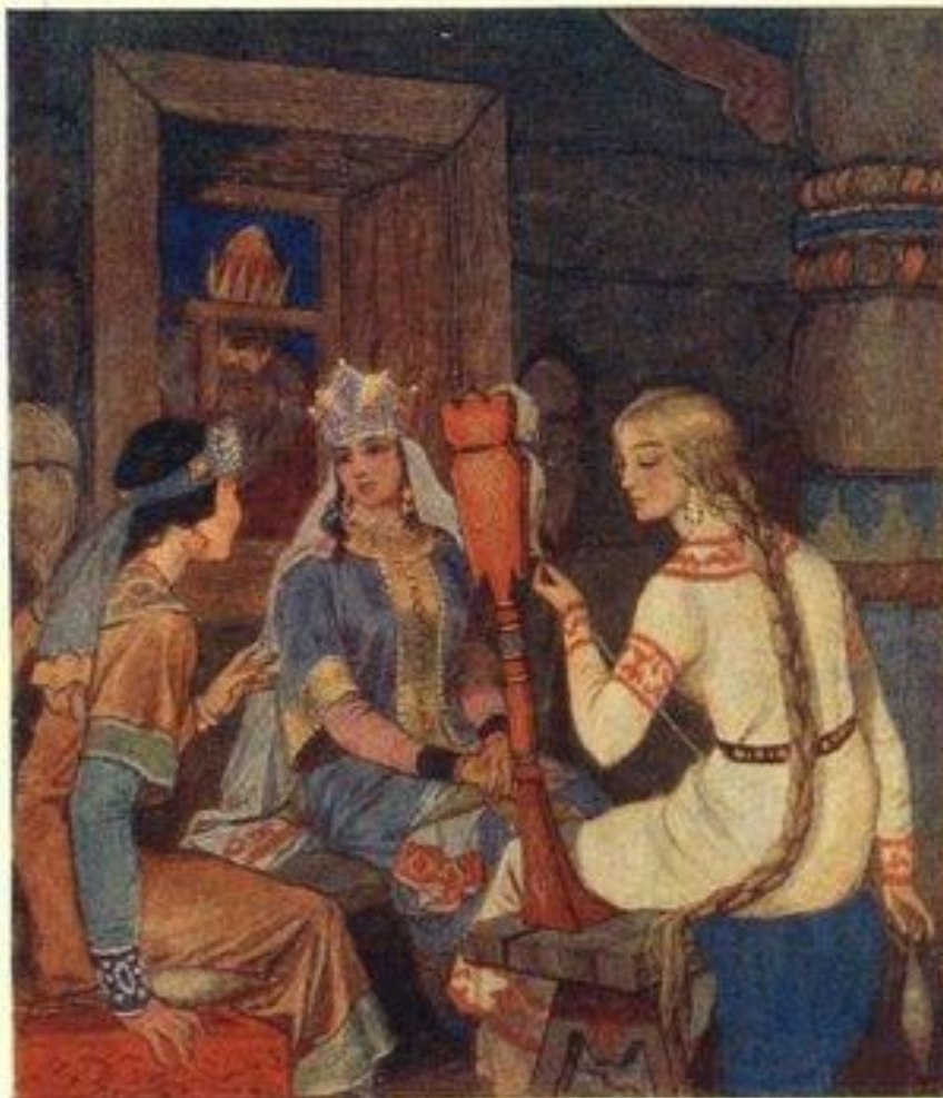
Три девицы под окном Пряли поздно вечерком.