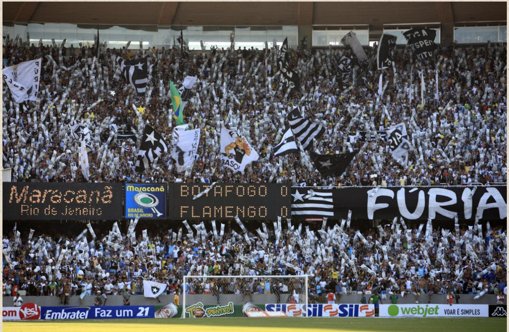
Стадион «Маракана» в Рио-де-Жанейро