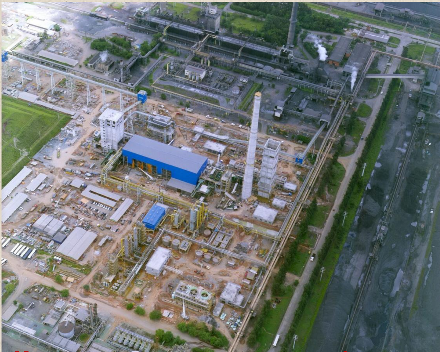
Металлургическое предприятие «Асоминас» (Бразилия).