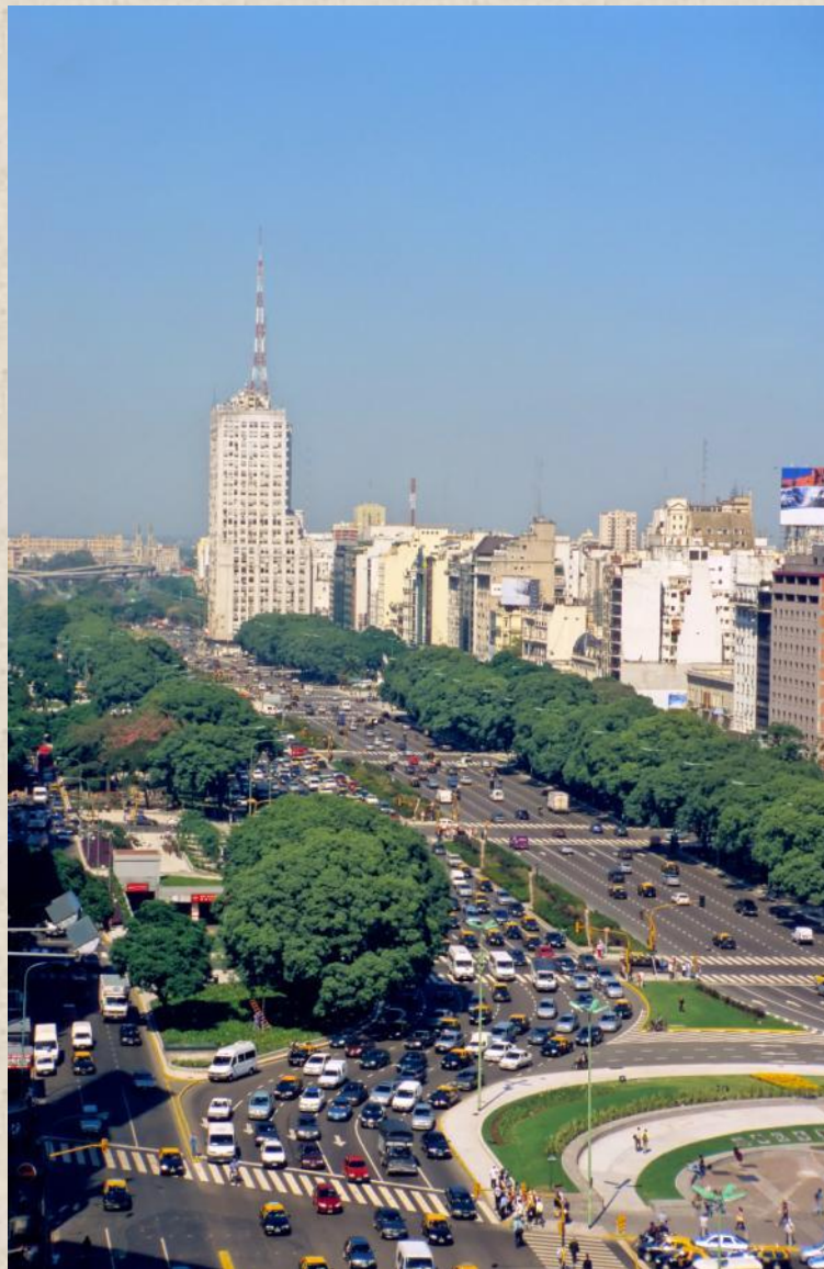
Улица 9 Июля в Буэнос-Айресе