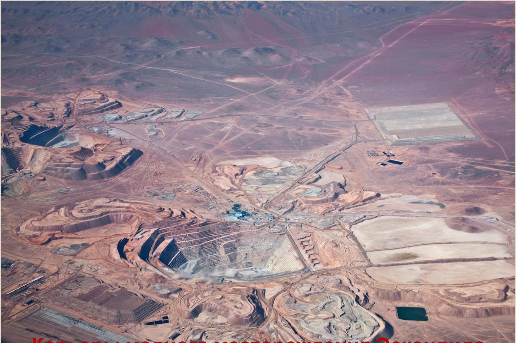
Карьеры медного месторождения Эскондида (Чили)