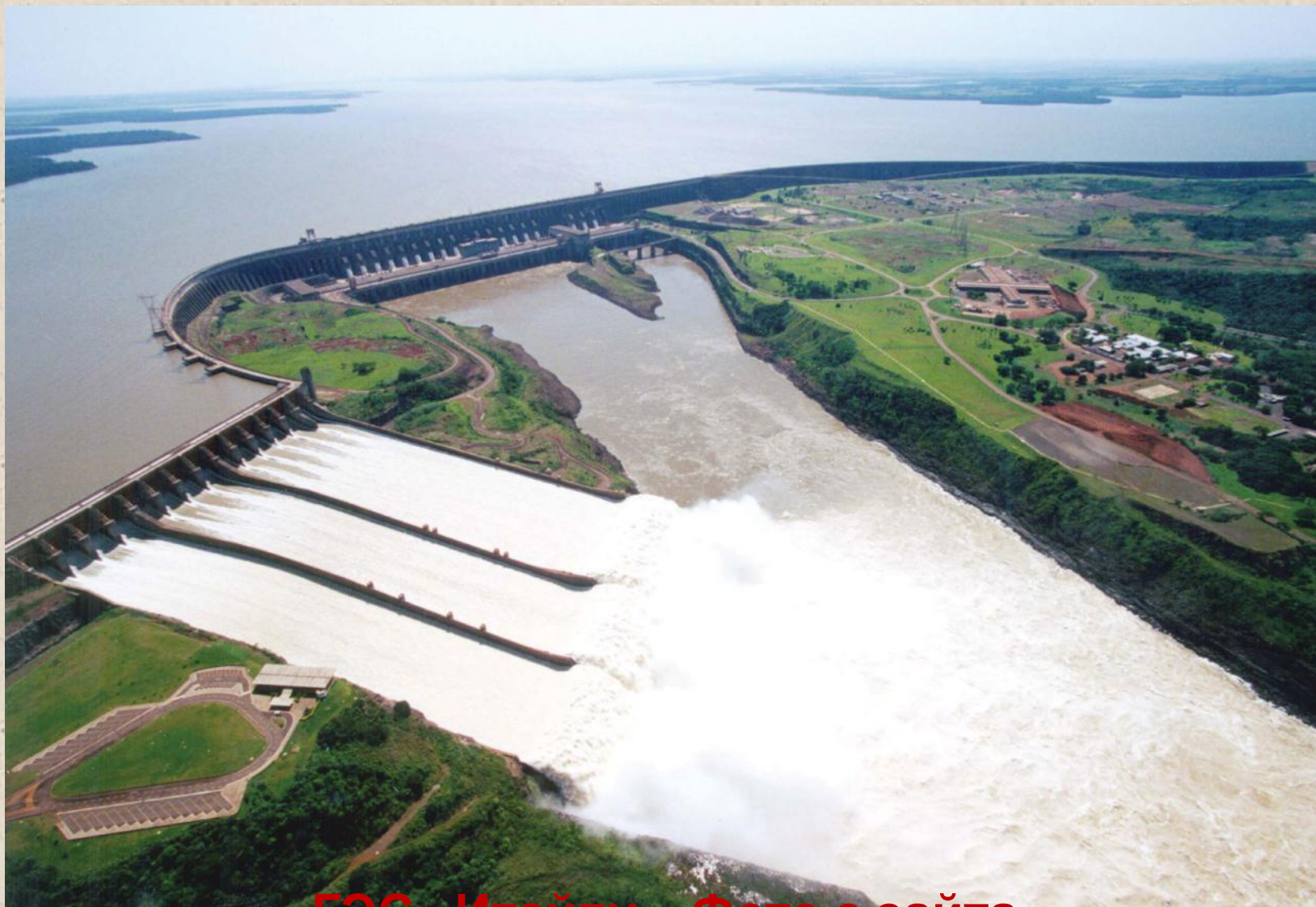
ГЭС «Итайпу».