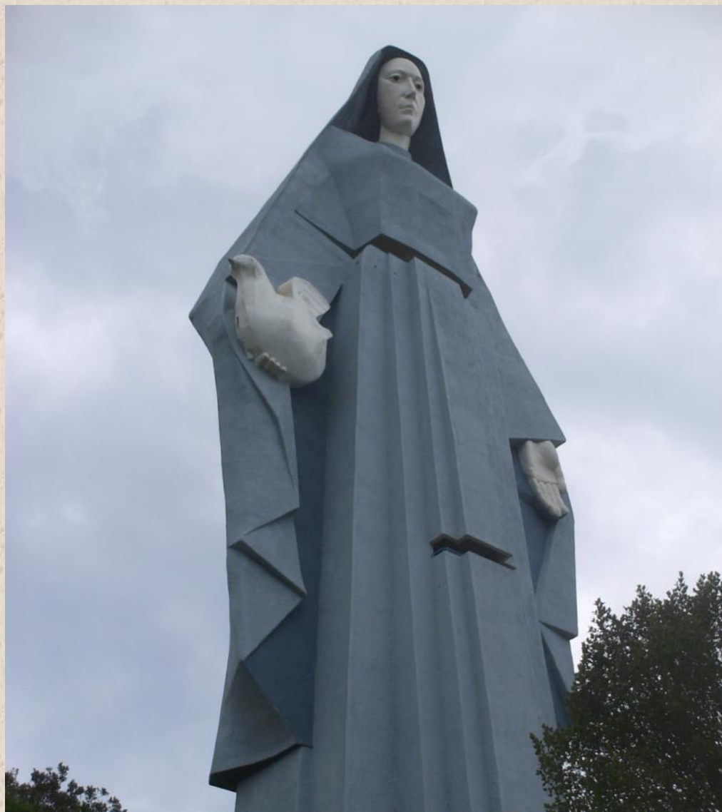
Богоматерь из венесуэльского Трухильо. Фото Wikipedia