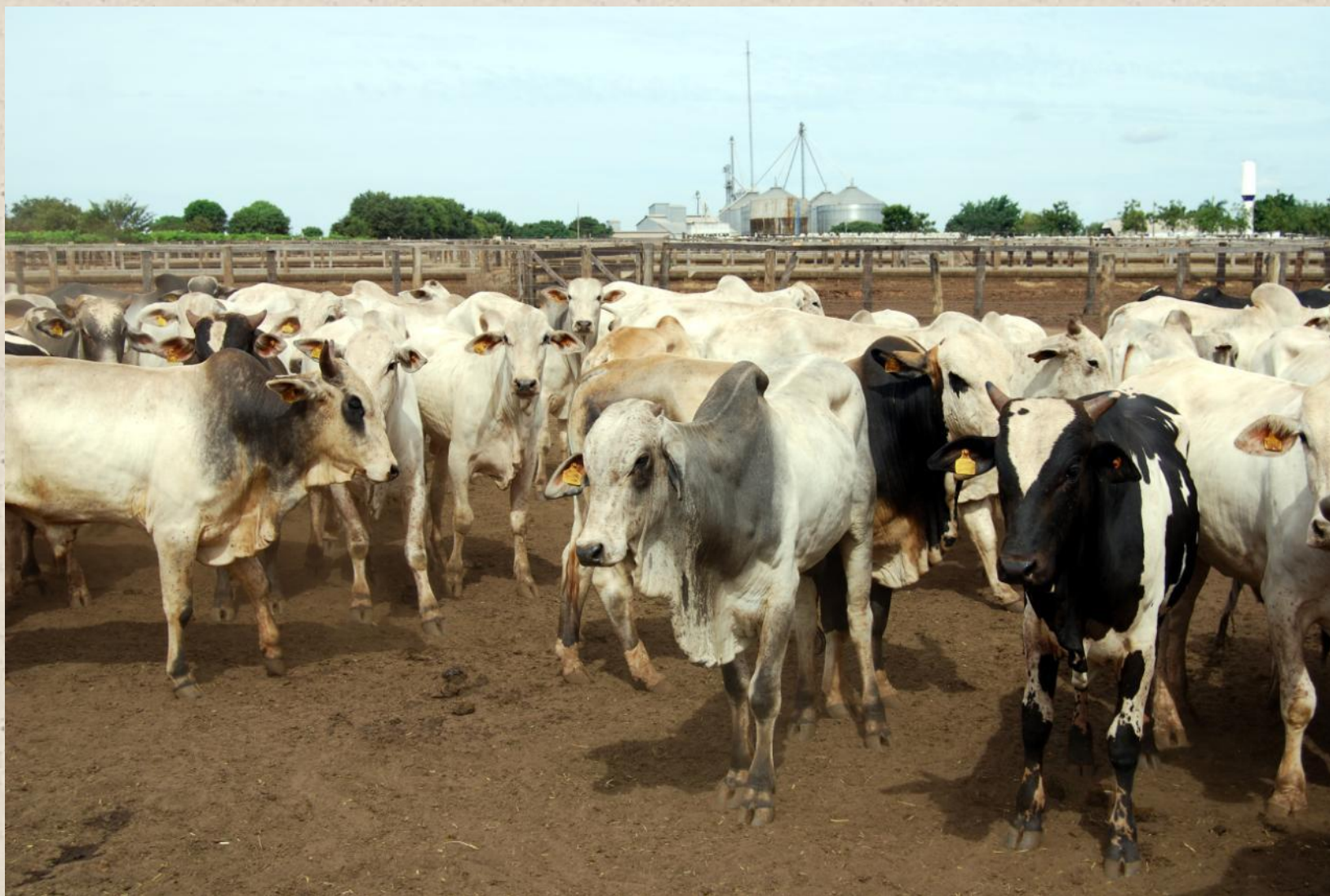
Зебу в Бразилии