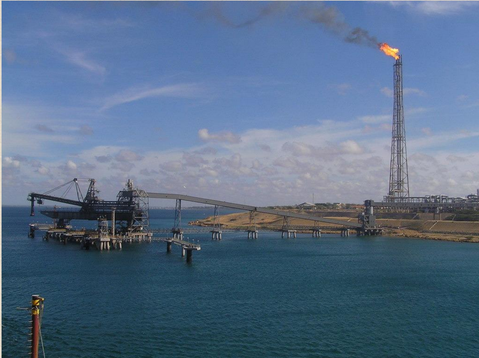
Причальный комплекс НПЗ в Парагуане (Венесуэла).