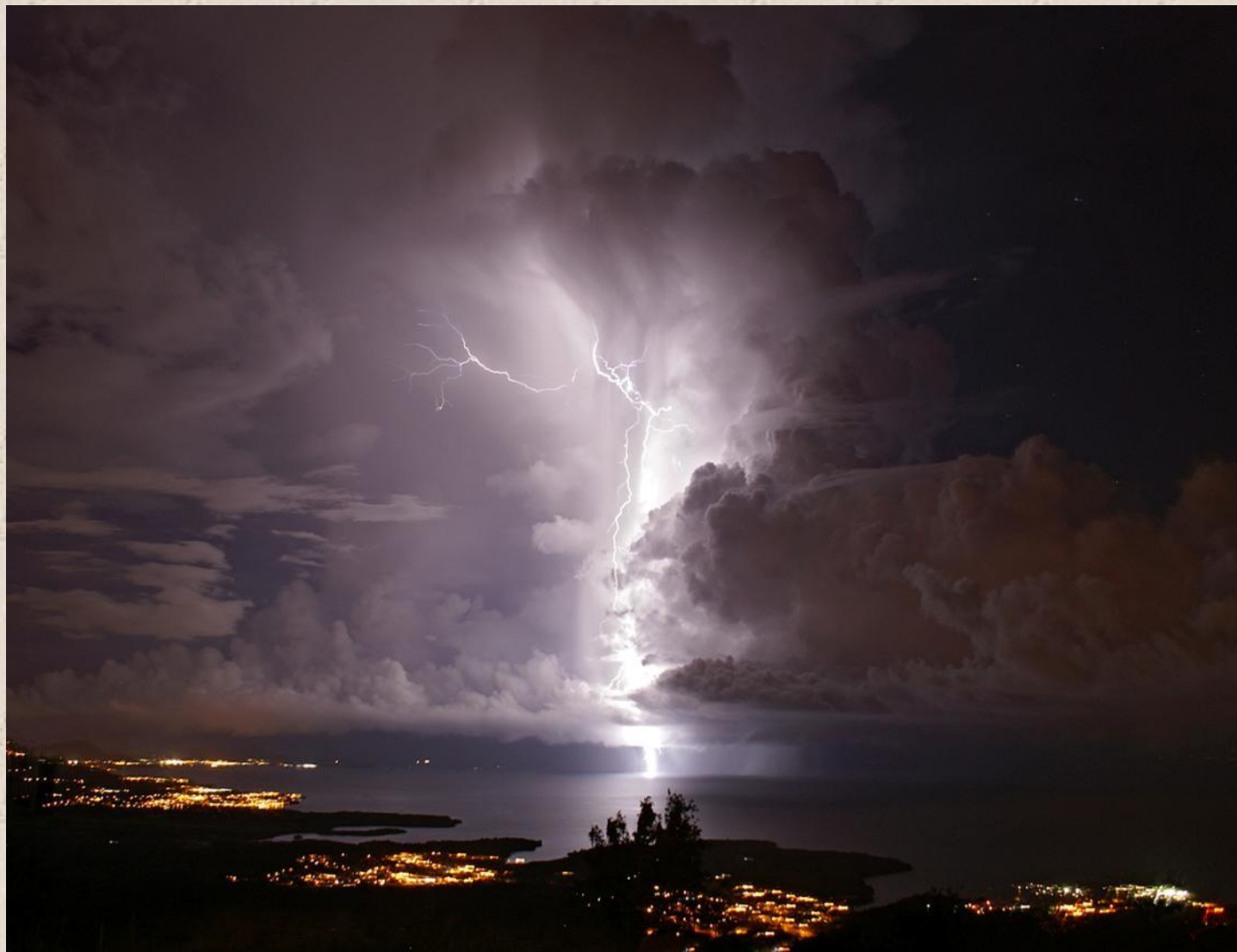
Молнии Кататумбо.