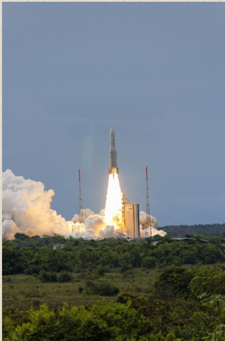
Космодром Куру во Французской Гвиане