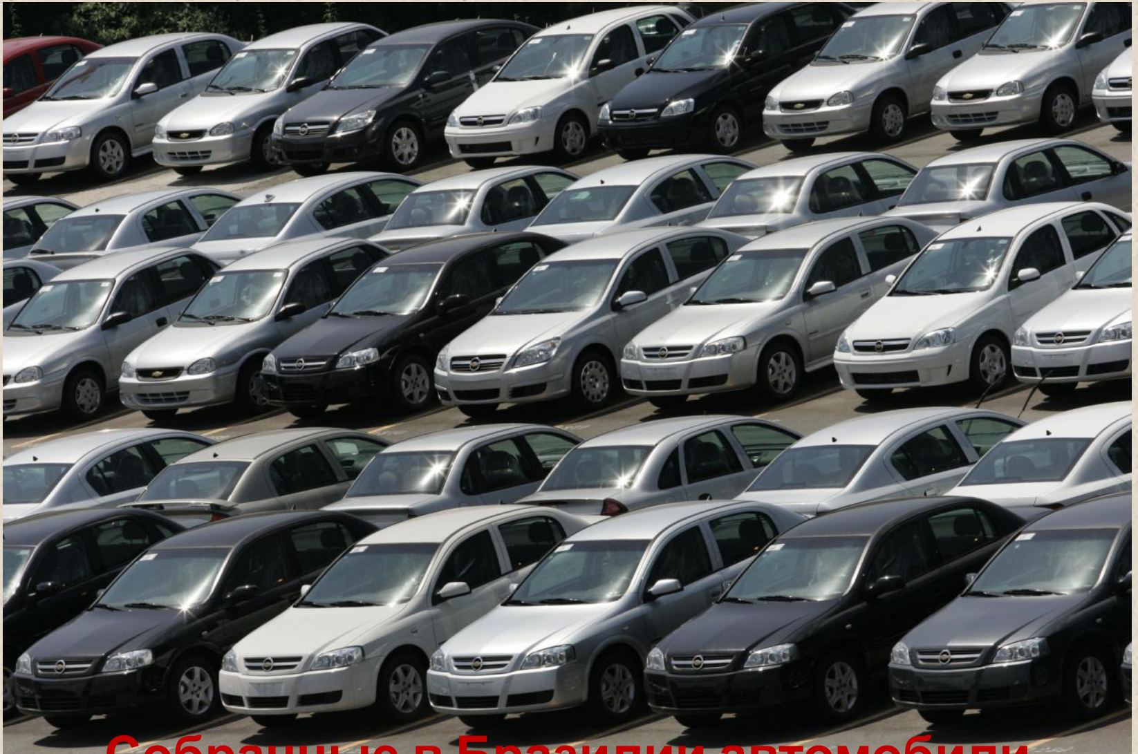
Собранные в Бразилии автомобили «Шевроле»