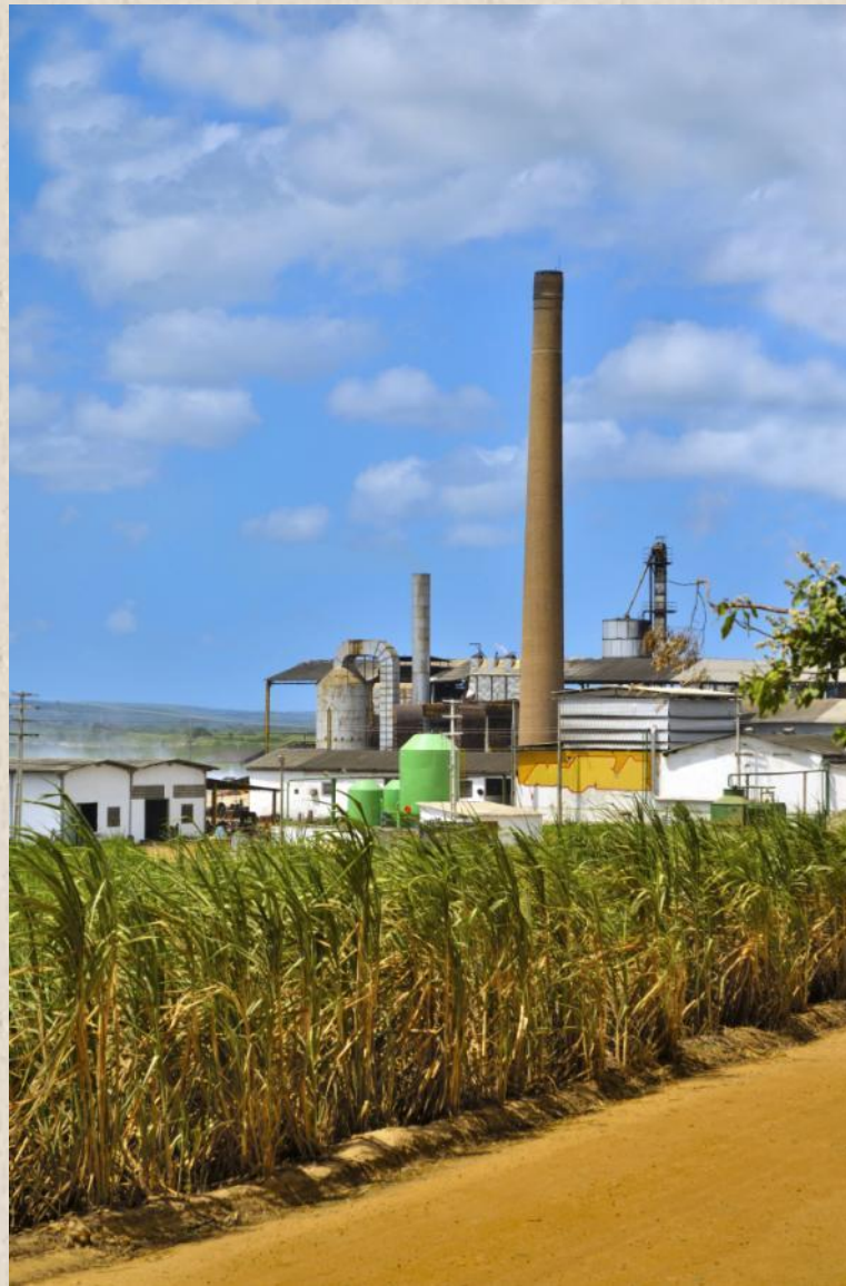
Завод по производству биоэтанола из сахарного тростника (Бразилия)