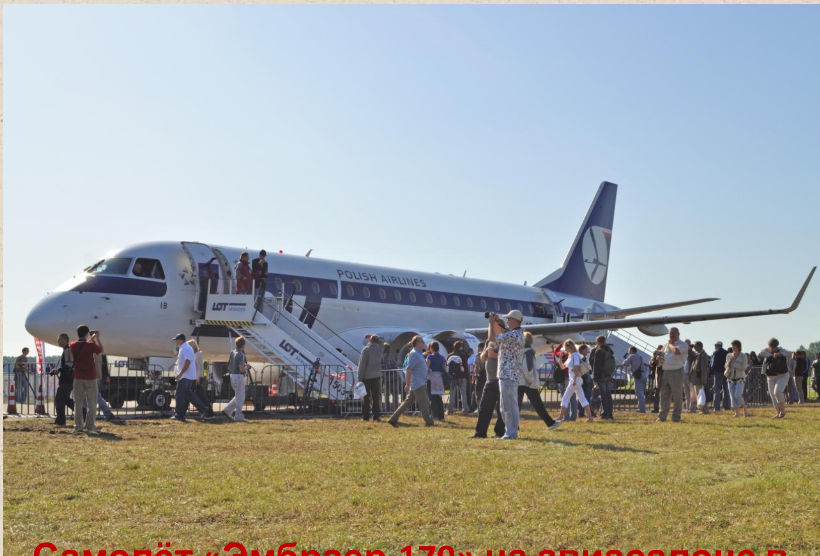
Самолёт «Эмбраер-170» на авиасалоне в Польше