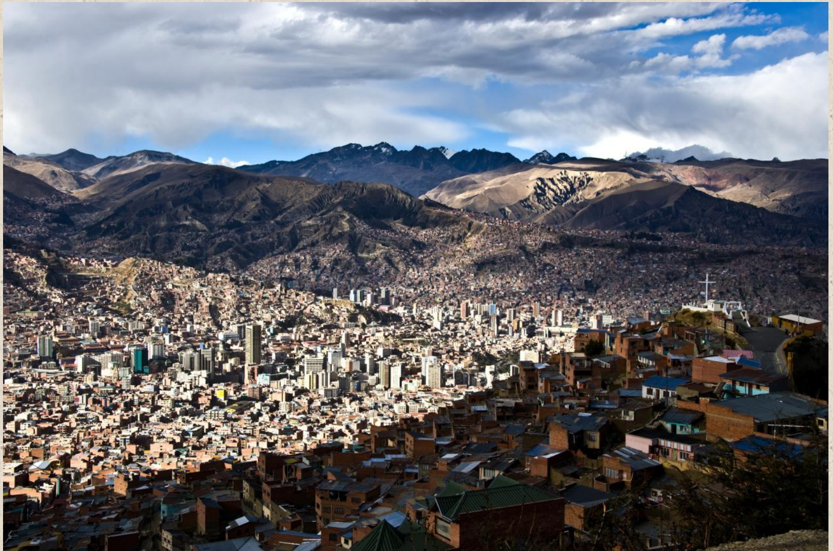
Панорама Ла-Паса — столицы Боливии