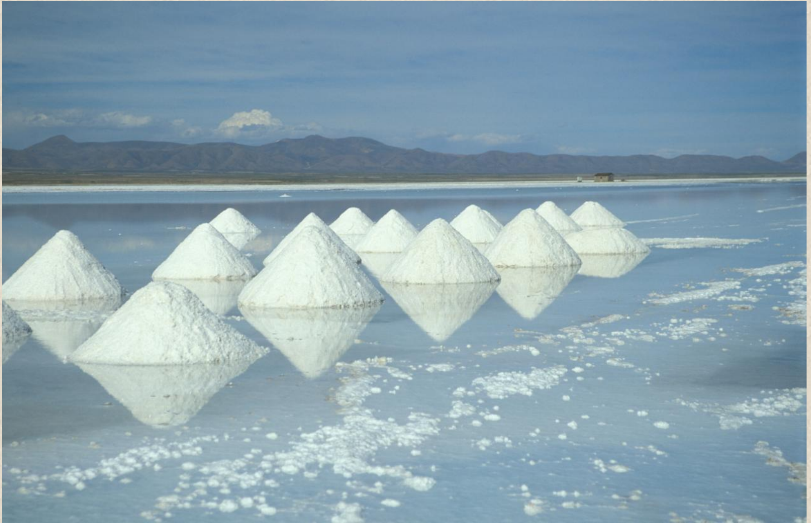
Солончак Уюни (Боливия)