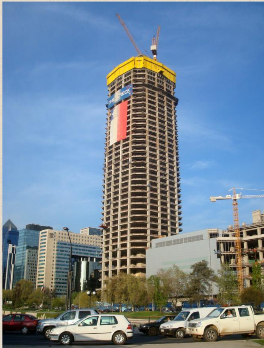
Строительство небоскрёба «Гран-Торре-Сантьяго» в столице Чили.