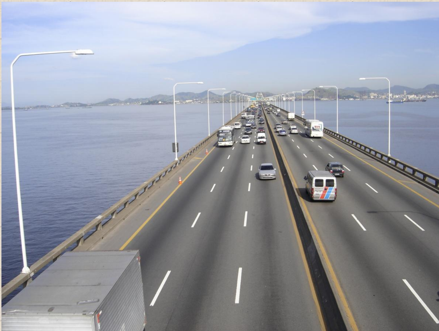
Мост между Рио-де-Жанейро и Нитероем (Бразилия).