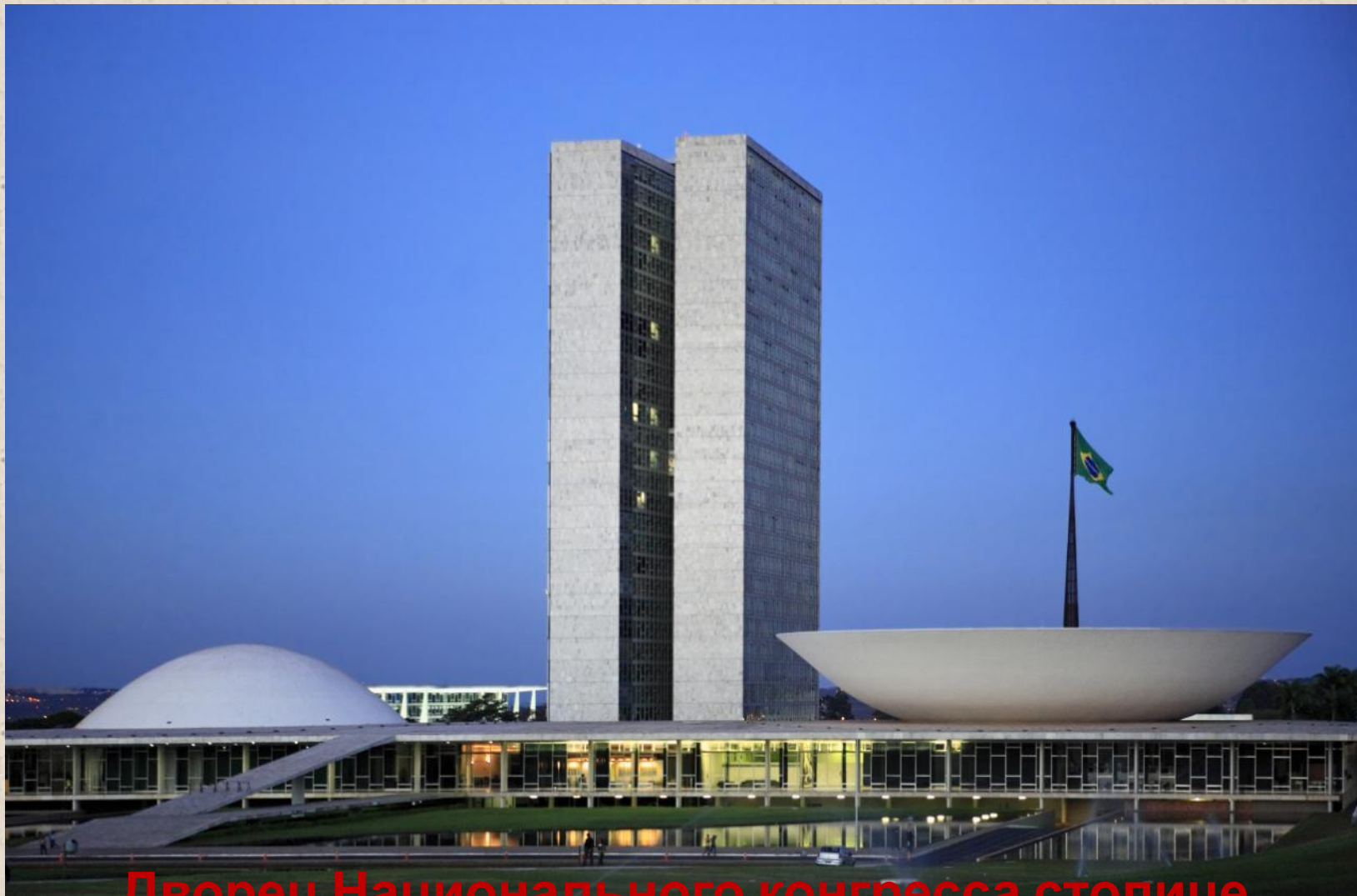
Дворец Национального конгресса столице Бразилии (архитектор О. Нимейер)