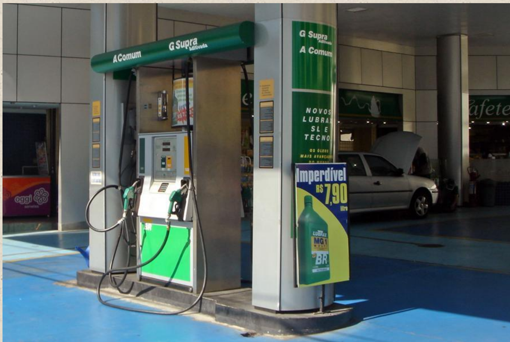
АЗС с биоэтанолом (штат Сан-Паулу)