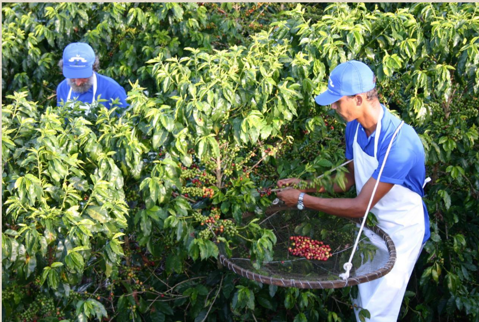
Сбор кофе в Бразилии