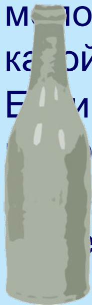
БУТЫЛКА МИНЕРАЛЬНАЯ ВОДА