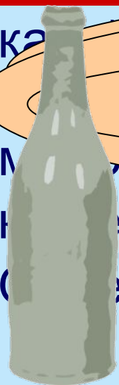
БУТЫЛКА МИНЕРАЛЬНАЯ ВОДА