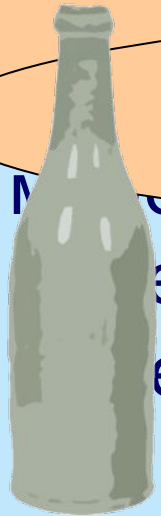
БУТЫЛКА МИНЕРАЛЬНАЯ ВОДА

СЮДА СТАКАН ПОСТАВИТЬ НЕЛЬЗЯ, ЗДЕСЬ ОН БУДЕТ СТОЯТЬ В СЕРЕДИНЕ СТОИТ СТАКАН. ЗНАЧИТ, В НЕМ – КОФЕ!