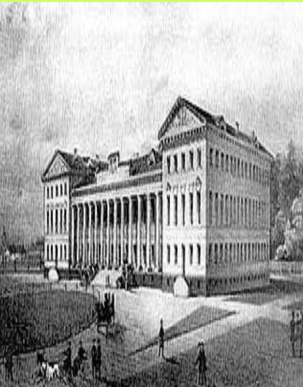
Нежин. Гимназия высших наук