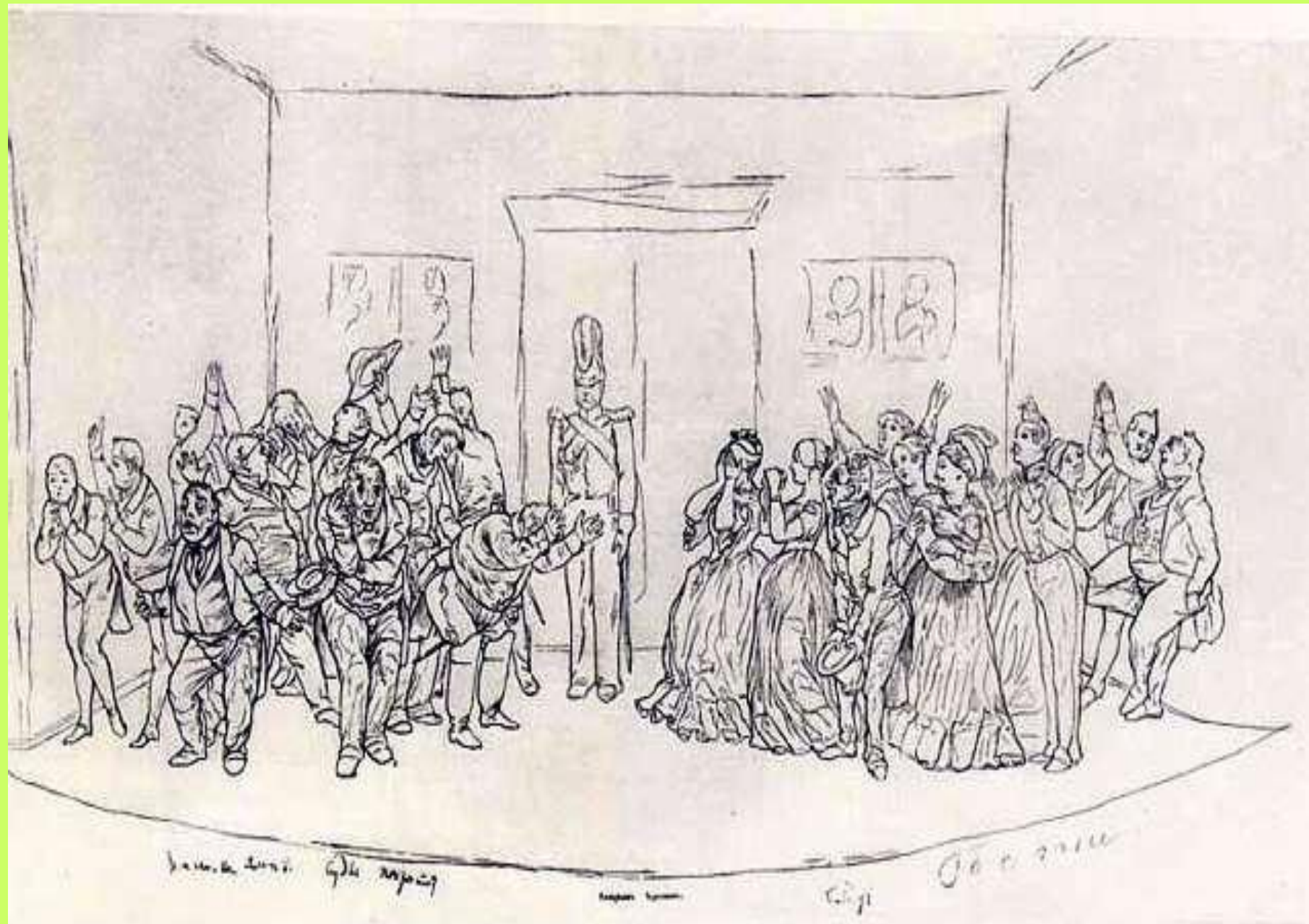
«РЕВИЗОР», ЗАКЛЮЧИТЕЛЬНАЯ СЦЕНА. Рисунок Н. В. Гоголя (?)