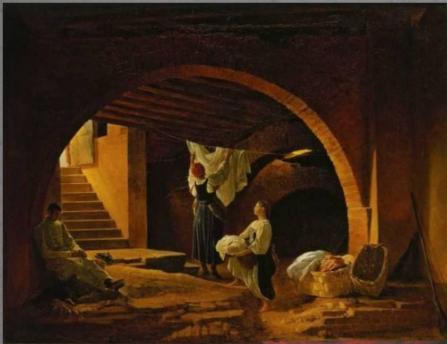
«Чердак здания Академии Художеств» 1831