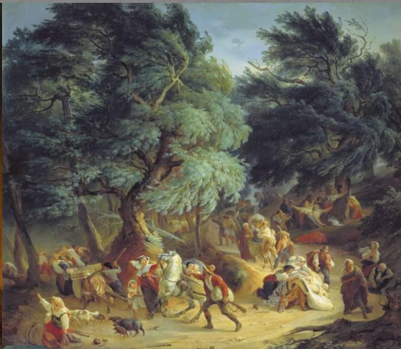
«Землетрясение в Рокка-ди-Папа, близ Рима». 1830