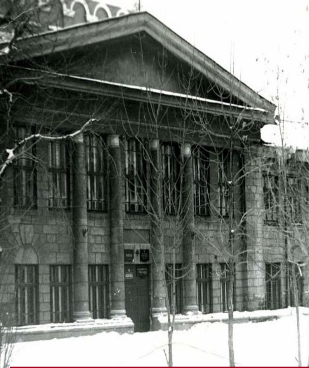
Здание медицинского училища до 1993 года

Колледж железнодорожной медицины УрГУПС был создан в 2005 году на базе Екатеринбургского медицинского училища железнодорожного транспорта МПС РФ. Училище имеет 70-летнюю историю подготовки медицинского персонала для лечебно – профилактических учреждений свердловской железной дороги.