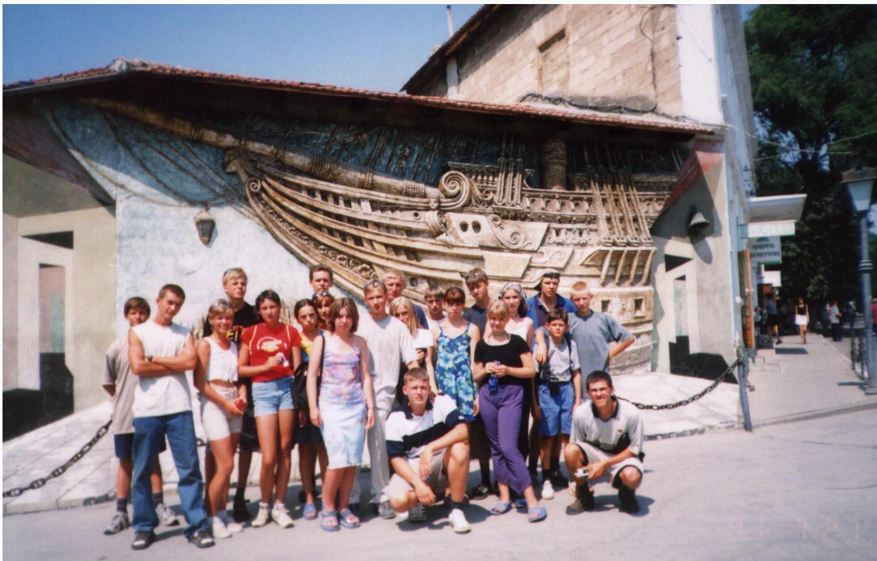
На экскурсии в городе Феодосия