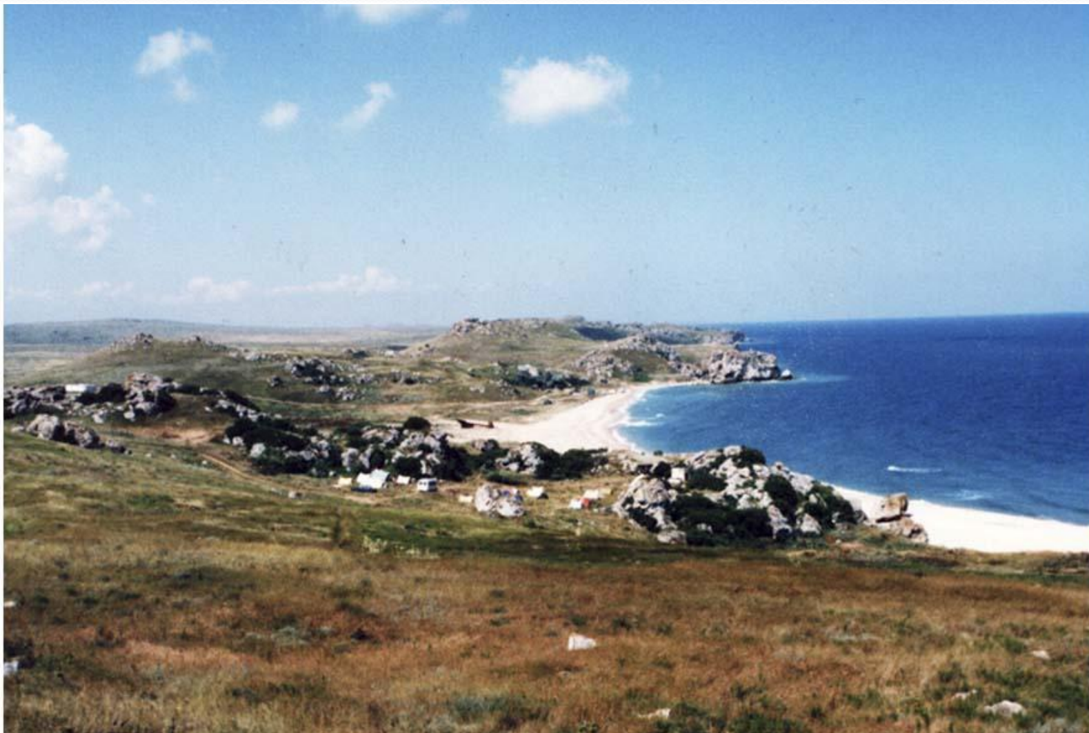
Вид бухты, в которой располагается стоянка лицейского отряда