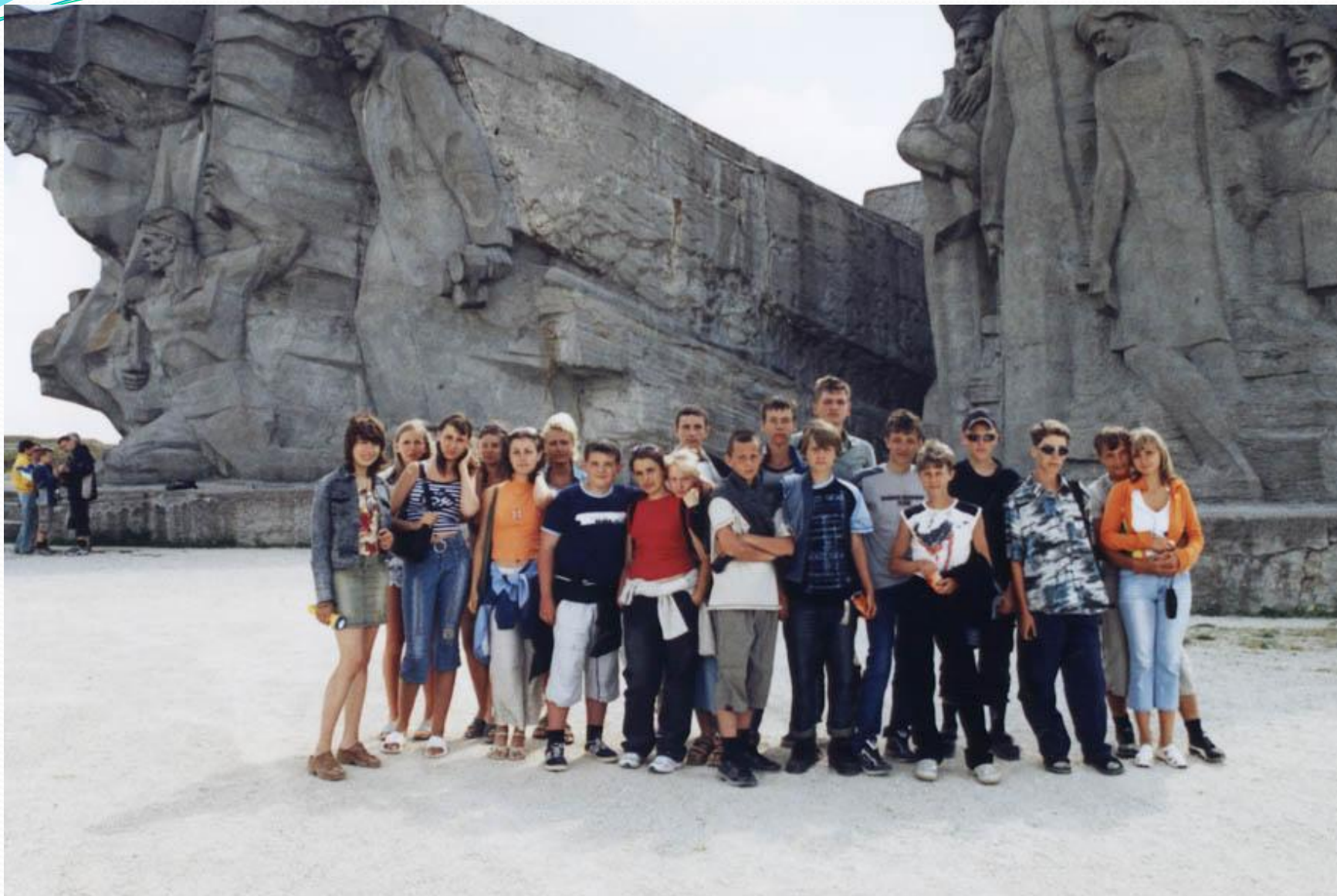
На экскурсии в Аджимушкайских каменоломнях