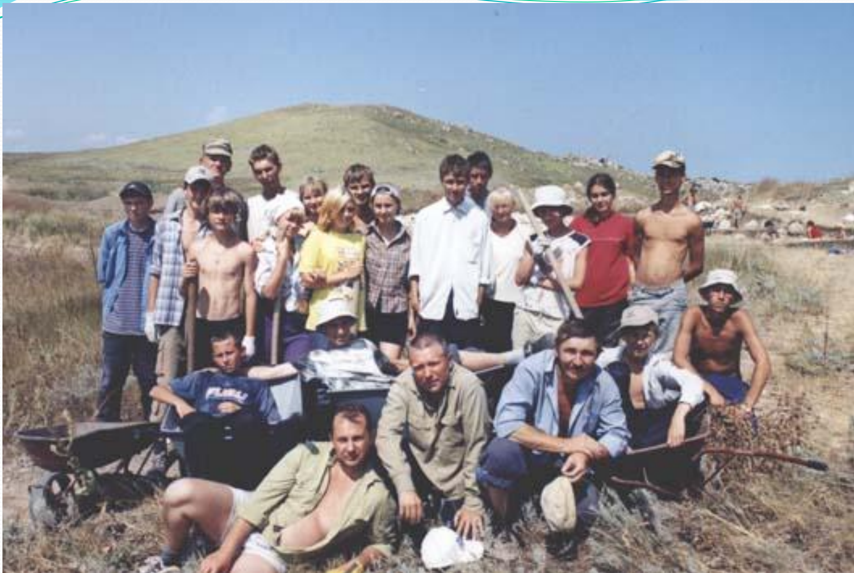
Фотография после раскопа