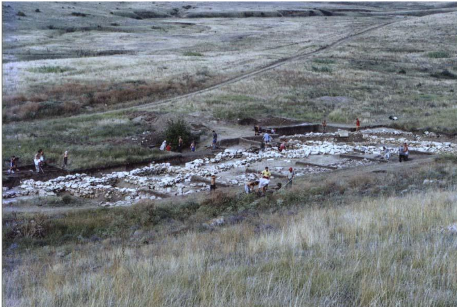
Общий план раскопок