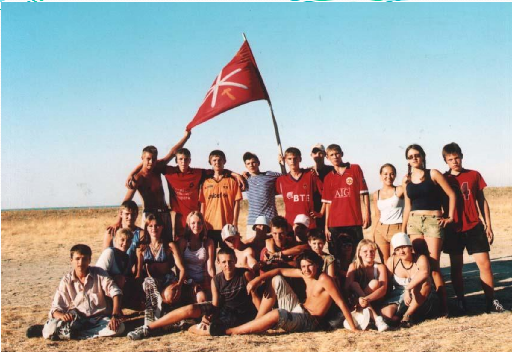
Фотография после футбольного матча с московским отрядом