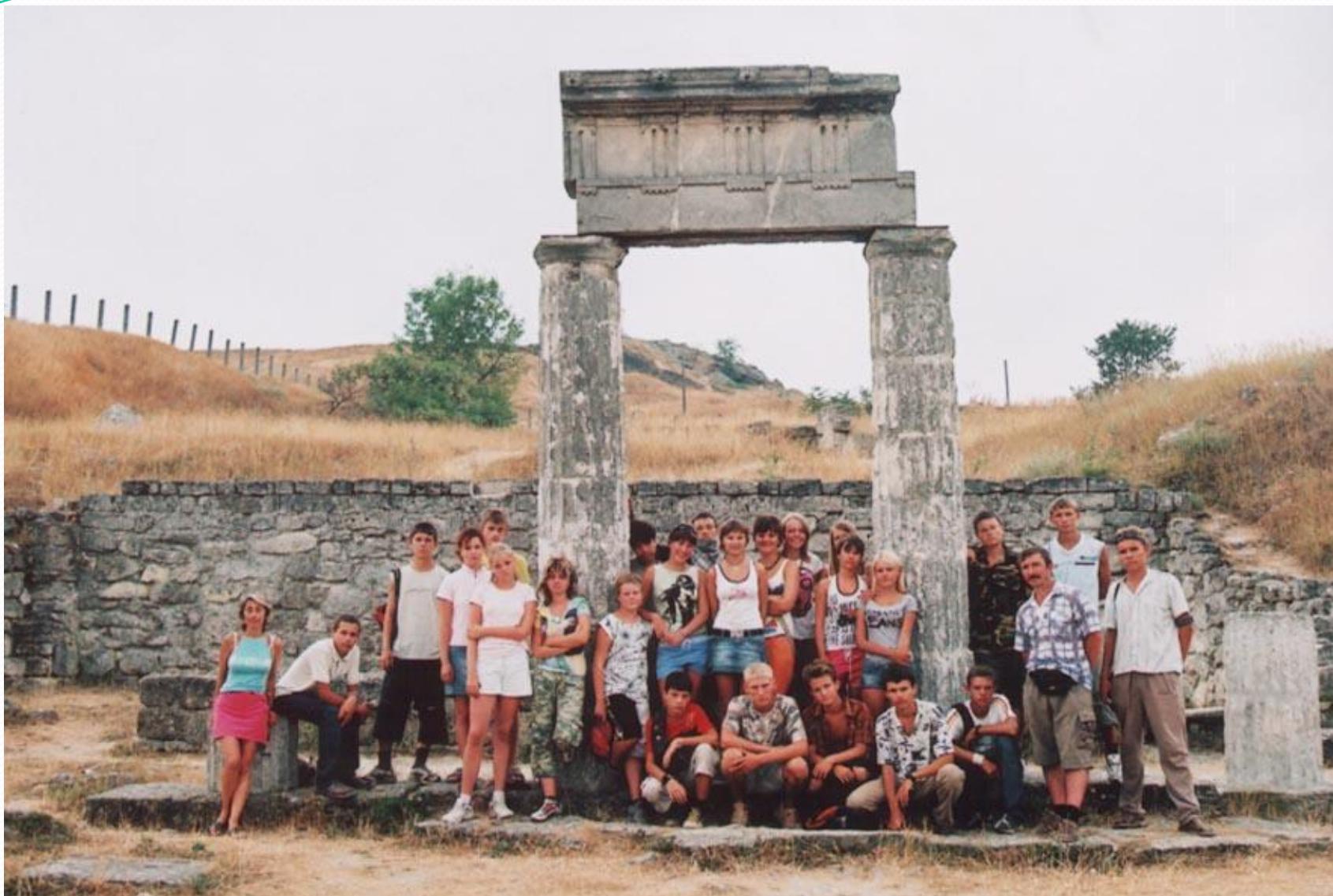
Керчь. Гора Митридат. Пританий