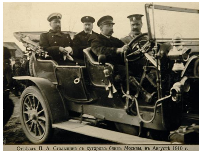
Отъезд П. А. Столыпина с хуторовъ близъ Москвы, въ Августѣ 1910 г.