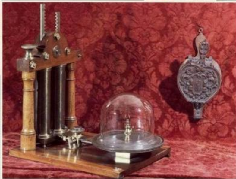
Восстановленная модель 1730 г. Музей М.В. Ломоносова, Ленинград

Ломоносов считал химию своей «главной профессией», причем развитие химии, по мнению ученого, должно было идти по пути развития практических задач. «Истинный химик должен быть теоретиком и практиком», — писал он. Став профессором химии, Ломоносов начал заниматься созданием химической лаборатории.