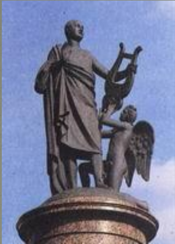
Памятник Ломоносову в г. Архангельске