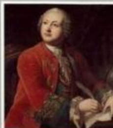
М.В. Ломоносов. Письменный стол 1710 г. Археологическая обстановка принадлежит музею

Ломоносов считал химию своей «главной профессией», причем развитие химии, по мнению ученого, должно было идти параллельно практическим задачам. «Истинный химик должен быть теоретиком и практиком», — писал он. Став профессором химии, Ломоносов начал заниматься созданием химической лаборатории.