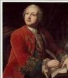
М.В. Ломоносов. Портретный эскиз 1730 г.

Ломоносов считал химию своей «главной профессией», причем развитие химии, по мнению ученого, должно было идти по пути развития практических задач. «Истинный химик должен быть теоретиком и практиком», — писал он. Став профессором химии, Ломоносов начал заниматься созданием химической лаборатории.