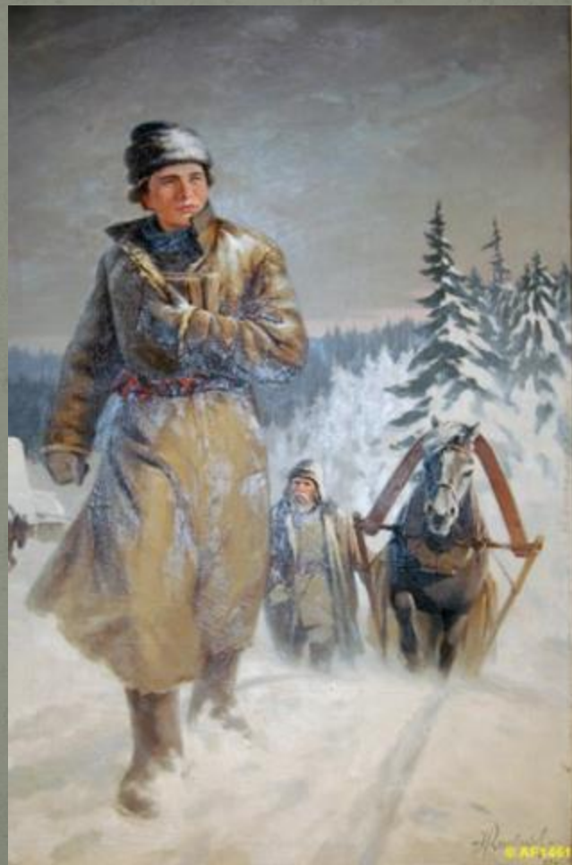
Н.И. Кисляков «Юноша Ломоносов на пути в Москву»