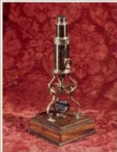
Модель 1700 г. Музей М.В. Ломоносова, Ленинград