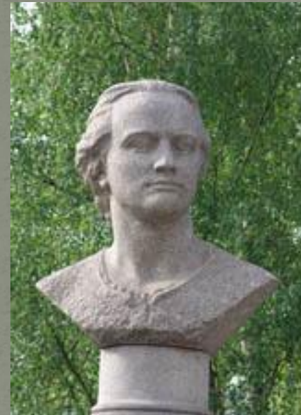
Пам'ятник Ломоносову в г. Архангельське у ПГУ ім М.В.Ломоносова