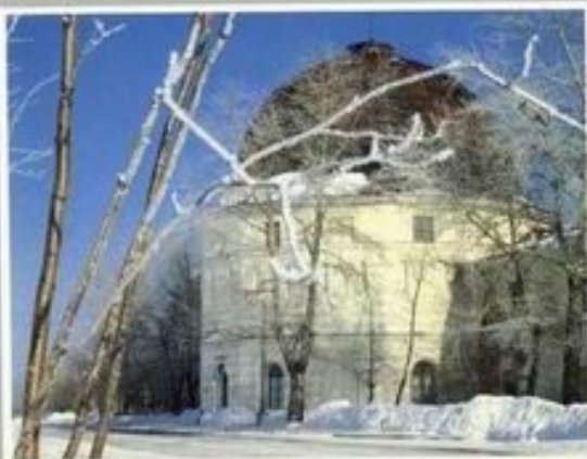
Гостиный двор Архангельска. Современный вид