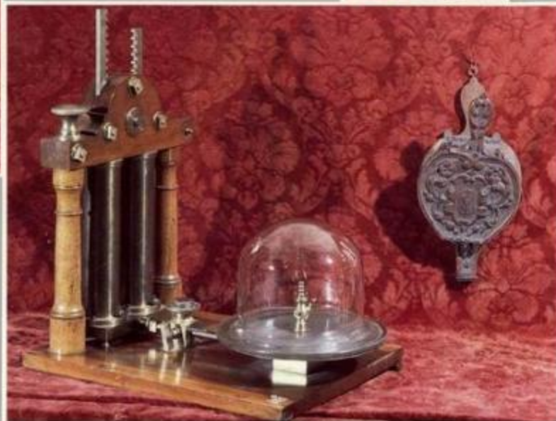
Восстановленная модель 1700 г. Музей М.В. Ломоносова, Ленинград

Ломоносов считал химию своей «главной профессией», причем развитие химии, по мнению ученого, должно было идти параллельно практическим задачам. «Истинный химик должен быть теоретиком и практиком», — писал он. Став профессором химии, Ломоносов начал заниматься созданием химической лаборатории.