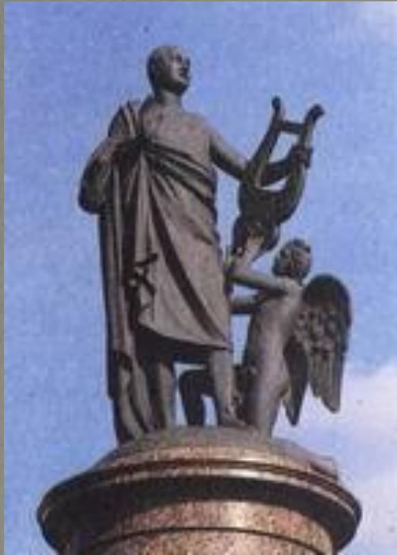
Пам'ятник Ломоносову в г. Архангельське