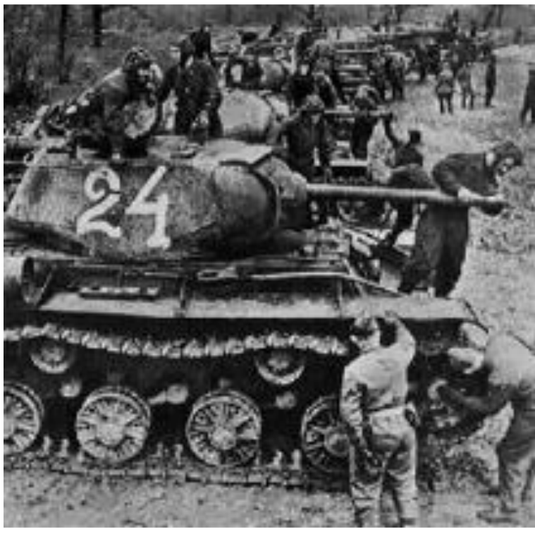
Советские танки Перед Курской битвой

12 июля советские войска перешли в наступление Под д.Прохоровка разгорелось крупнейшее в истории танковое сражение (1200 машин). Этот день стал переломным в ходе битвы. В течение месяца были освобождены Харьков, Орел, Белгород. Германия потеряла 500000 солдат, 1500 танков, 3700 самолетов. В сентябре 1943 г. началась битва за Днепр, и 6 ноября Красная Армия освободила Киев.