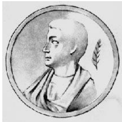
Гораций Квинт Флакк 65 - 8 до н.э.

Памятник продолжает традицию горацианского “Elegi monumentum” (ода «К Мельпомене») – эти слова использованы Пушкиным в качестве эпиграфа