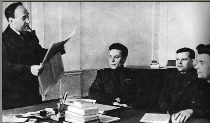
Штаб партизанского движения возглавляемый П.К. Пономаренко