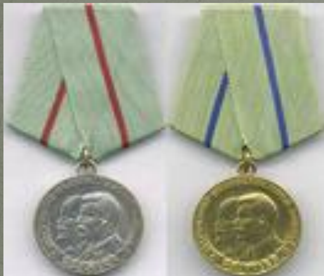
Медаль «Партизану Отечественной войны»

Всего за годы войны 87 партизан и подпольщиков Беларуси стали Героями Советского Союза, свыше 140 тысяч награждены орденами и медалями.