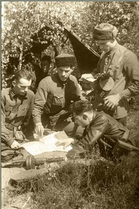
Партизаны за разработкой очередной операции