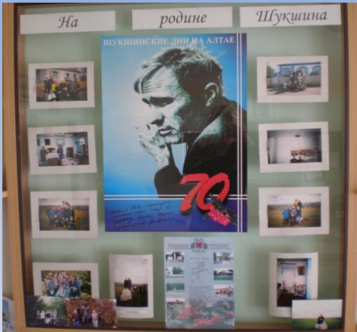
На родине В.М.Шукшина