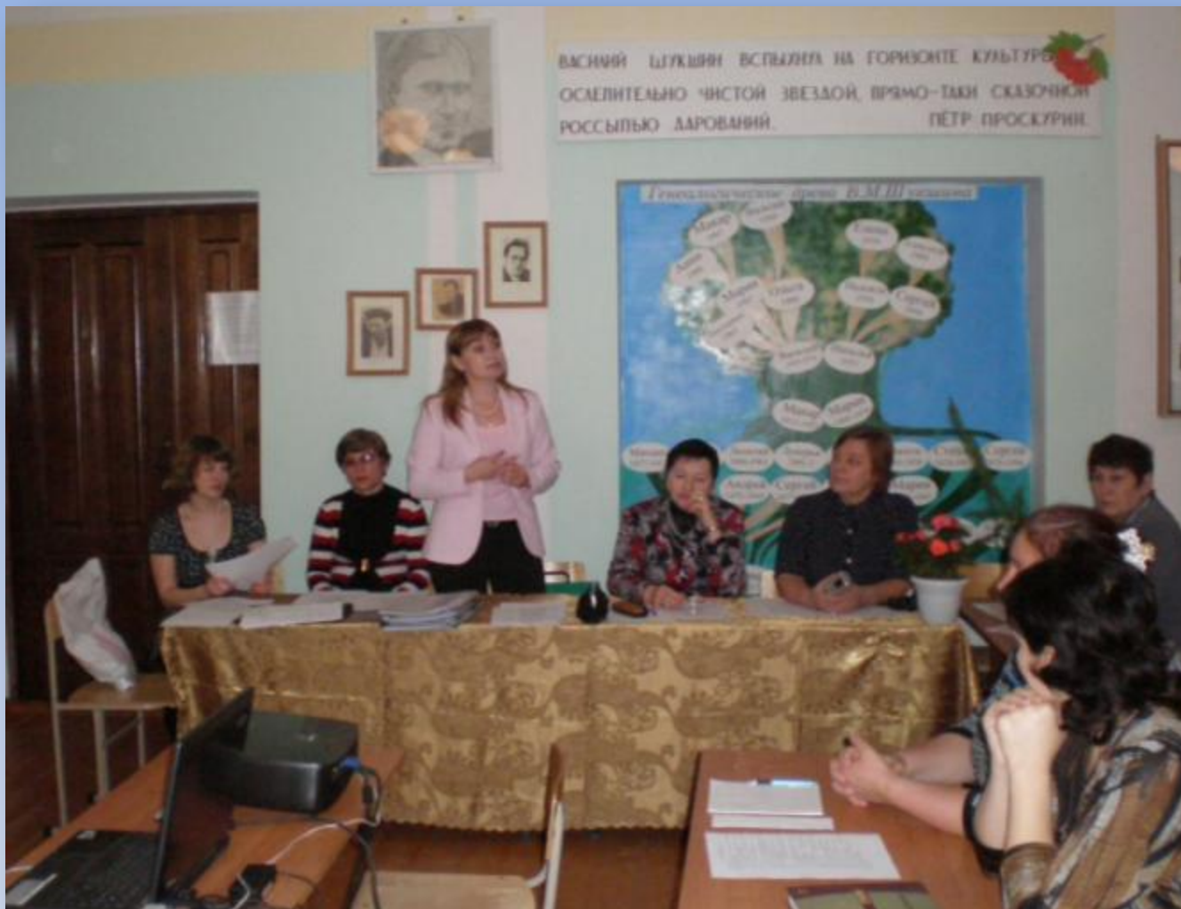
Районный семинар «В.М.Шукшин – уникальное явление русской культуры»