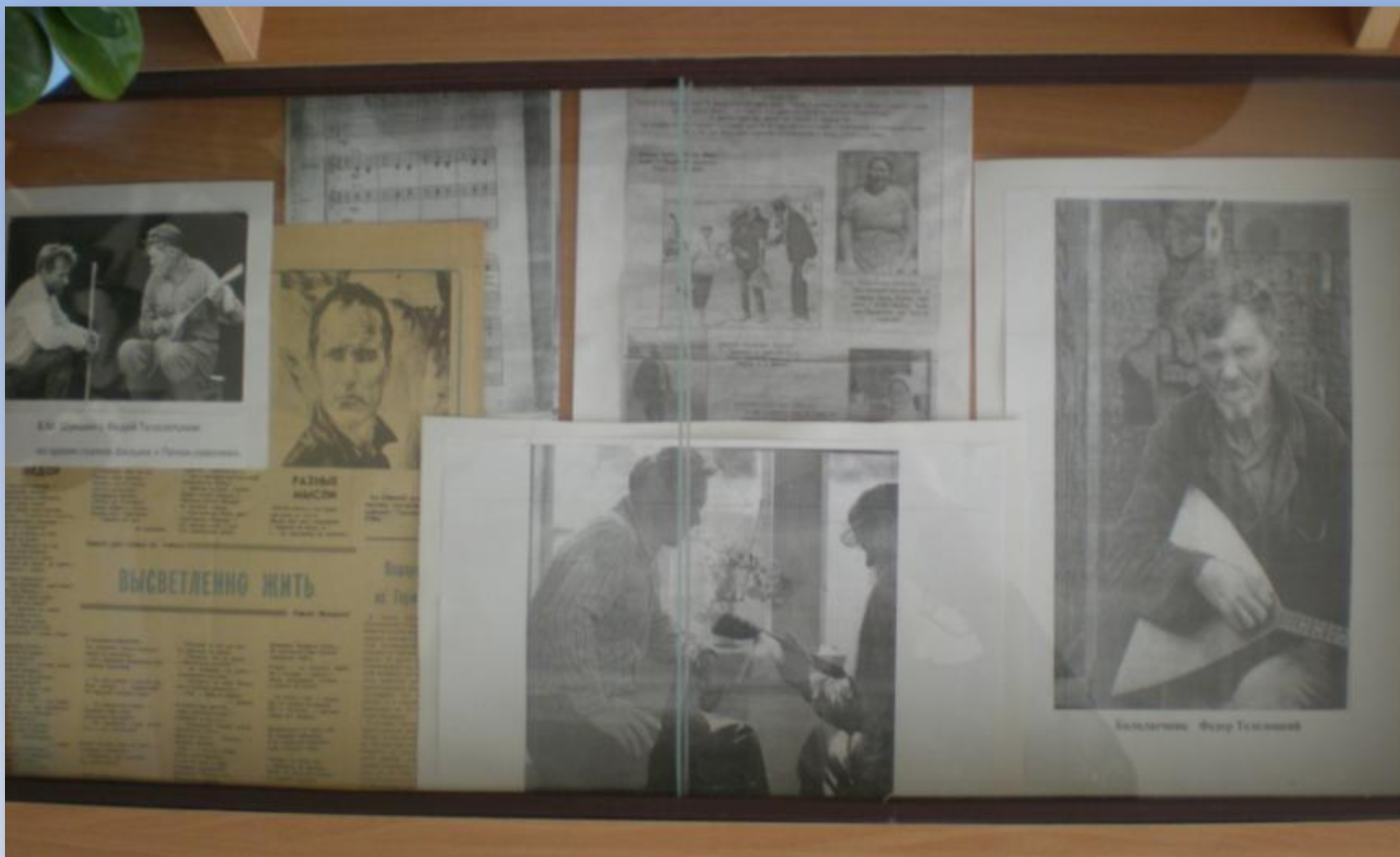
Ф.Телелинский – герой фильма «Печки-лавочки»