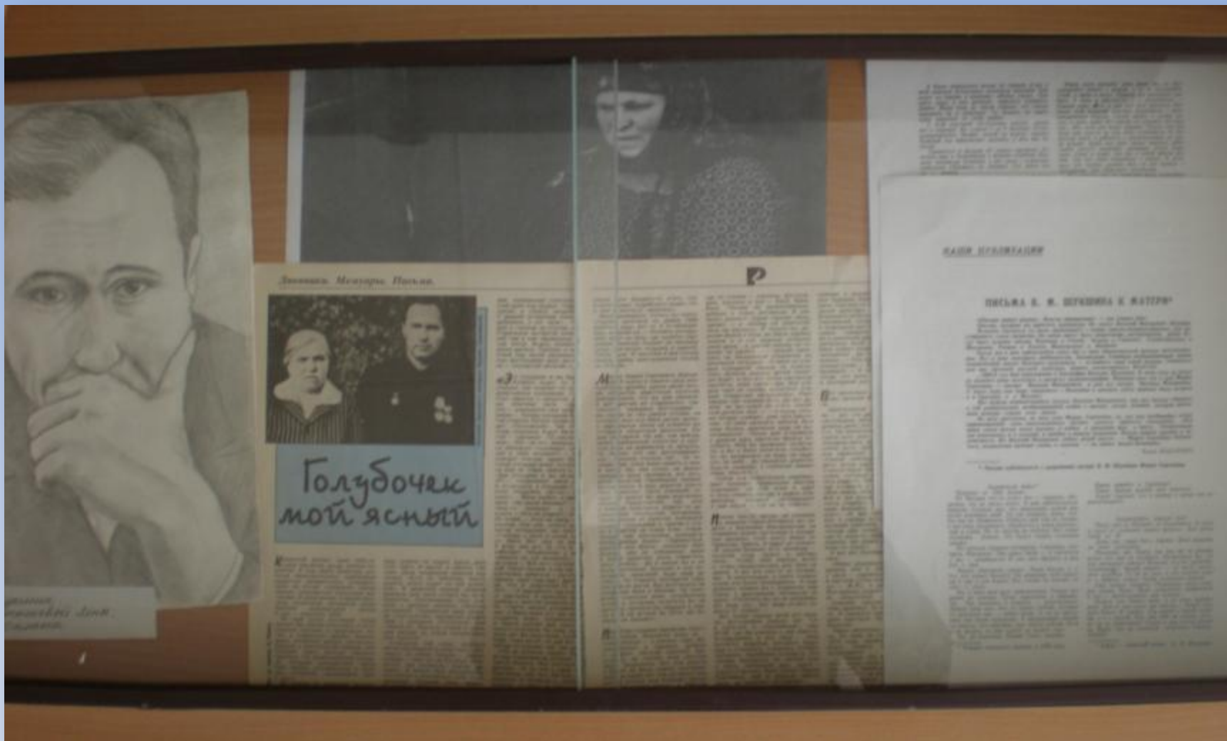
«Голубочек мой ясный»