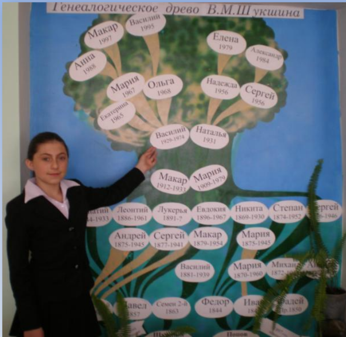
Генеалогическое древо В.М.Шукшина